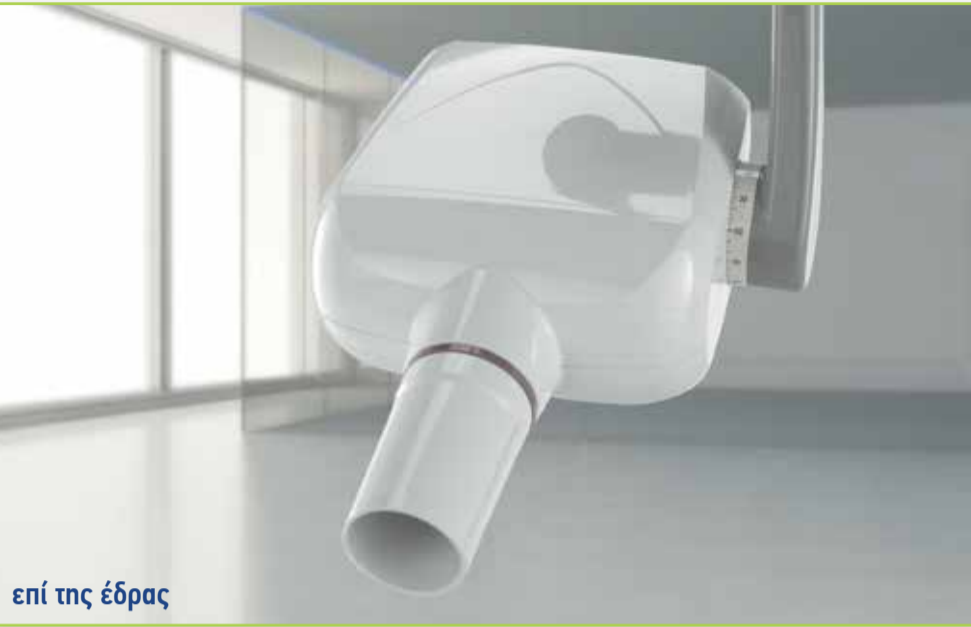
επί της έδρας