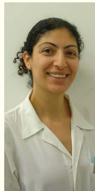
Istraživanje dr. Elinor Halperson se fokusira na oralnu manifestaciju karcinoma i izazove u liječenju karcinoma kod pedijatrijskih pacijenata kao i na različite vrste tretmana i njihov uticaj na oralni kavitet onkoloških pacijenata.

Dr. Halperson vjeruje da će rezultati pomoći pri uspostavljanju međunarodnog vodiča za praćenje i liječenje djece sa dentalnim anomalijama kao i za identifikaciju rizika negativnih dentalnih efekata specifičnih tretmana u različitim fazama razvoja djece. Međutim, također je rekla za Dental