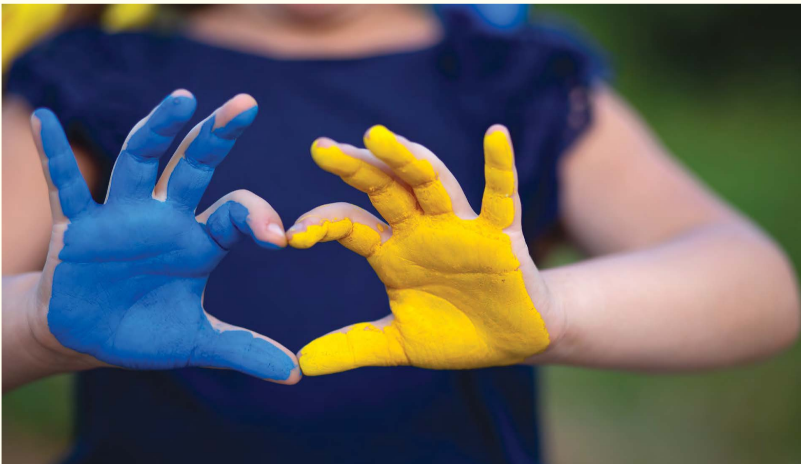
Evropska federacija parodontologije je potvrdila svoju posvećenost u podržavanju Ukrajine u najnovijim dešavanjima.

BEČ, Austrija: Evropska federacija parodontologije (EFP) je održala prvi sastanak uživo nakon 2019. godine 26. marta ove godine. Godišnji sastanak se održao u austrijskoj prijestolnici Beču gdje je ukazana dobrodošlica novom predsjedniku, prof. Andreas Stavropoulosu, i gdje je pokrenuta kampanja za pružanje finansijske pomoći Ukrajini.