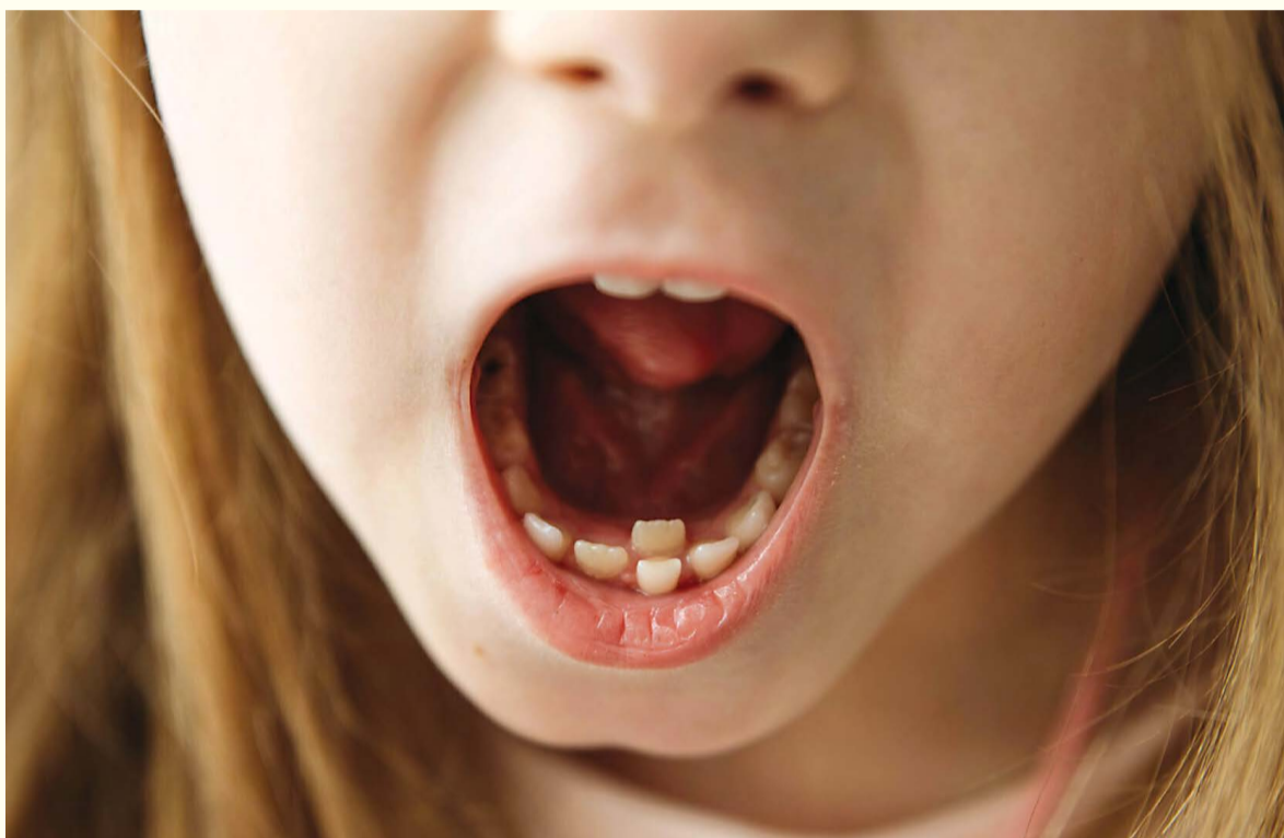
Istraživači su otkrili da kombinovanjem hemoterapije i radioterapije, a naročito radijacije na području glave i vrata, povećava rizik od razvoja dentalnih anomalija kod djece koja u preživjela karcinom.

JERUSALEM, Izrael: Prethodno je ustanovljeno da odrasle osobe koje su se podvrgle liječenju karcinoma mogu imati dentalne anomalije. Međutim, nije postojalo nijedno istraživanje koje je ispitalo učinke bilo koje terapije protiv karcinoma na dentalno zdravlje. Popunjavajući tu prazninu ovom studijom, istraživači iz Izraela su otkrili da razvijanje dentalne anomalije (engl. DDAs) se razlikuje kod djece koja su preživjela karcinom u zavisnosti od vrste onkološkog tretmana koji su dobili. Rezultati su pomogli da se identifikuju ona djeca kod kojih je liječen karcinom i koja su izložena povećanom riziku od javljanja dentalnih problema.