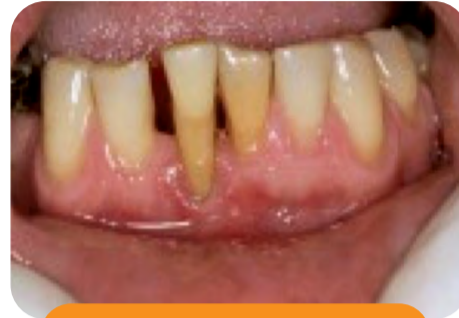
Parodontitis - početni stadij

Među čimbenicima koji pospješuju razvoj tih bolesti su bakterijski plak koji na gingivi potiče razvoj upalne reakcije, zubni kamenac te zaostala hrana koja na rubu gingive može traumatizirati tkivo što postaje idealan medij za nakupljanje bakterija. U zdravim ustima s očuvanim zubnim nizom i dobrim oblikom gingive teško je naći ostatke hrane. Međutim, gubitak kontakta između dvaju susjednih zuba, bilo da je riječ o karijesu, neodgovarajućem ispunu (istog zuba u suprotnoj čeljusti) najpodmukliji je čimbenik u razvoju parodontnih bolesti. Zato je iznimno bitno izgubljeni zub nadoknaditi odgovarajućim proteinskim nadomjestkom kako bi se