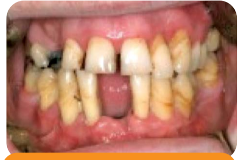
Parodontitis- uznapredovali stadij

sačuvala funkcija žvakanja. Važnu ulogu u razvoju imaju loši dentalni nadomjesci (npr. odstojeći ispuni zuba, odstojeći rubovi krunica te dijelovi proteza i kvačica koji ako leže na zubnom mesu mogu dovesti do iritacije, a posljedično recesije gingive i parodontnih džepova).