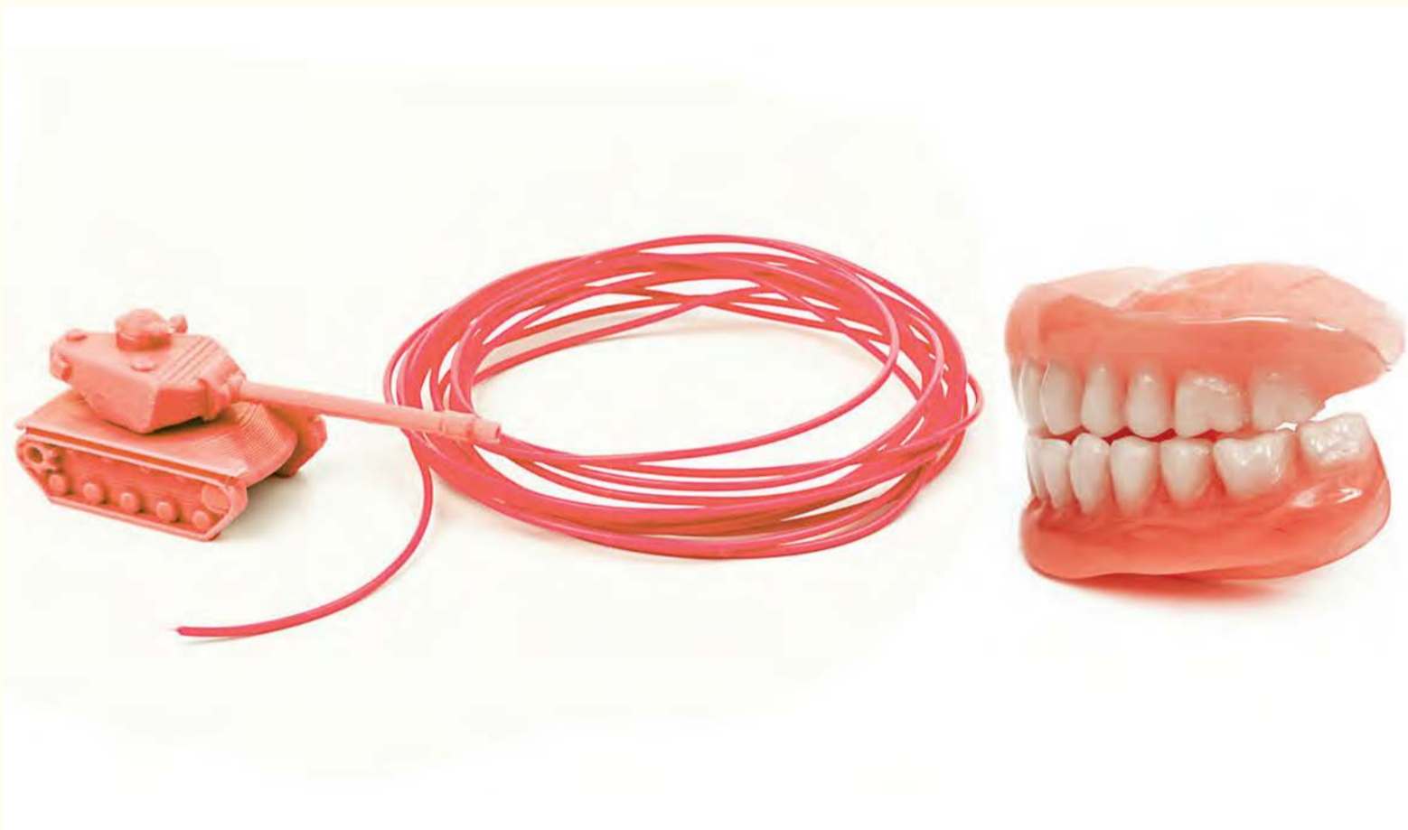
Vojska SAD-a već koristi 3D printanje kako bi obezbijedila medicinske usluge svojim vojnicima i veteranima širom svijeta.

SAN DIEGO, SAD: 3D printanje je moćna tehnologija koju je vojska počela primjenjivati širom svijeta. Vojni ljekari sad koriste ovu tehnologiju u nadi da će omogućiti pristup specijalizovanoj dentalnoj brizi za vojnike bilo gdje u svijetu.