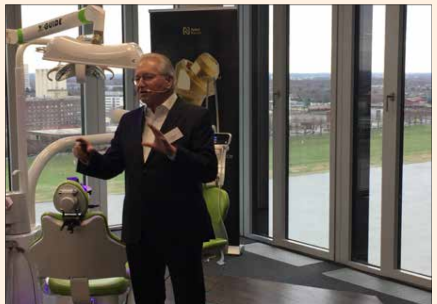
Un momento de la presentación de las superficies Xeal y TiUltra de Nobel Biocare.

Nobel Biocare anunció una nueva era en la implantología oral, bautizada con el nombre de “Mucointegración”, con el lanzamiento de las superficies Xeal y TiUltra en Colonia. Las nuevas superficies, que se pueden aplicar no solo a los implantes sino también a los pilares, han sido creadas para optimizar la integración del tejido a todos los niveles y mejorar los resultados del tratamiento. Basándose en décadas de experiencia en la tecnología de anodización aplicada, Nobel Biocare sabe que para una óptima integración de los implantes dentales se requiere de diferentes superficies para cada tejido. Si bien la osteointegración es fundamental para la función a largo