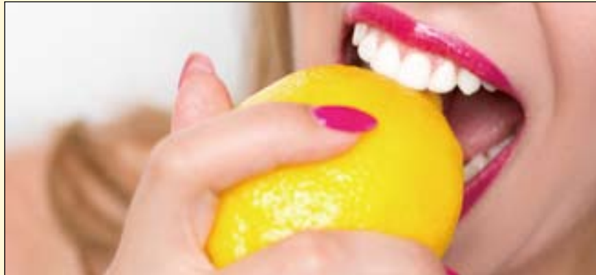
德国研究人员发现, 调味剂可增强人体唾液的分子防御能力。

唾液保护口腔免受外部病原体的侵害。作为先天分子免疫系统的一部分, 唾液含有各种抗菌分子, 包括抗菌酶溶菌酶。该研究的结果发现, 柠檬酸会使溶菌酶浓度水平增