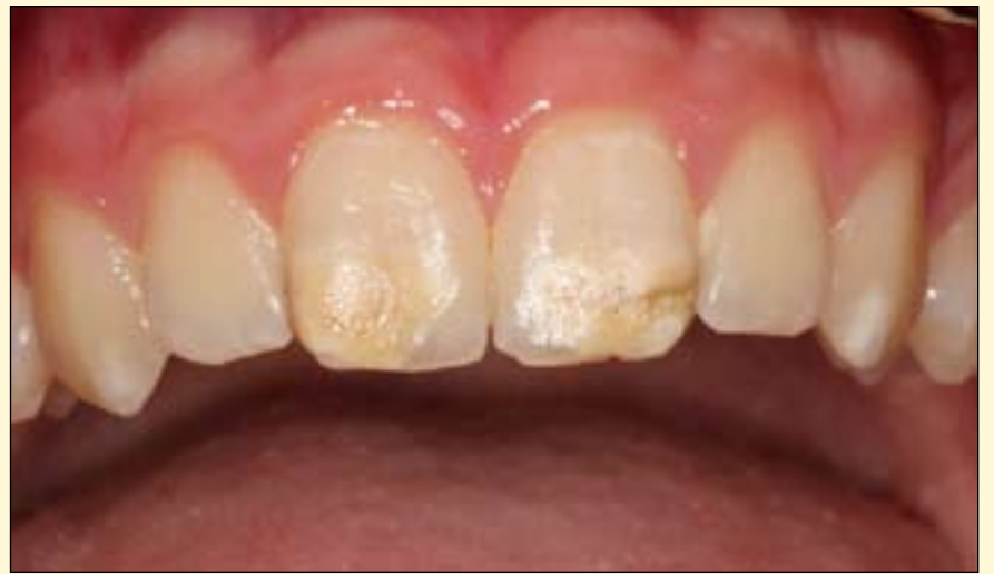
据德国牙科及口腔疾病学会报道：德国年轻人口中，MIH发病率高于龋坏率。（图片：Norbert Krämer教授）