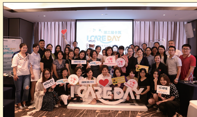
“iCARE Day”主题活动嘉宾合影照

服务管理工作的过程中，感觉到当今社会之浮躁尤其需要提倡服务的精神，来提升整个口腔行业对服务质量的重视，让专业技术人员获得尊重。因此创建一个服务品牌的想法在我心中油然而生，我希望通过iCARE的品牌，传递一种“care”的精神与服务的理念，来汇集更多价值观相同的从业者。