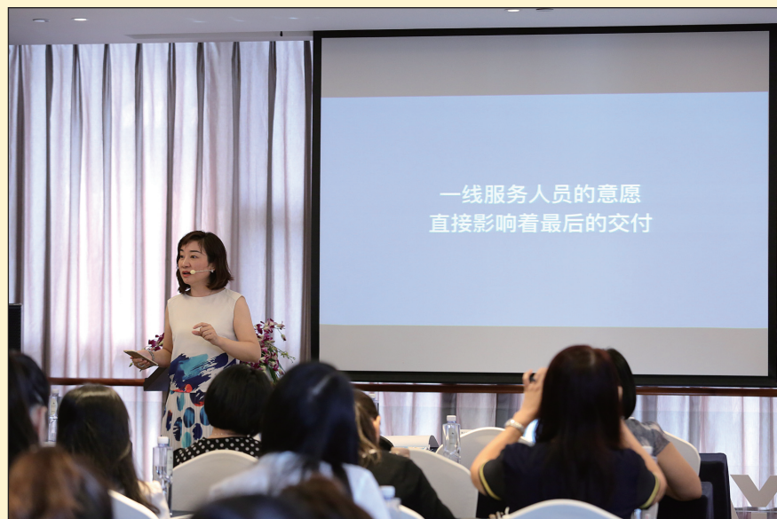
徐总为参会人员分享iCARE品牌的服务内涵

徐总：对于我个人来说，我的小目标是继续激发和培养员工的服务心态。今天在以体验经济为主的环境下，不管做什么行业，服务永远是必须做的事。如果只有产品，服务没跟上，就不能说我们为客户提供了一个完整的解决方案。那服务的提供者是谁？是我们的员工。所以，好的服务，就是要激活员工，给顾客制造意外的惊喜。iCARE对内是“i care employees”，我们有Quartely Development Meeting、内部刊物、工程师多路径职业规划、阶梯式培训、工程师之星选拔……我们记录了每一位员工的发言，珍视每一位员工的创意，提供一切机会让他们去尝试、创新，让更多的员工show出最真实的自己。所以，我们的服务团队能在工作压力很大的情况下依然积极地工作。我为每一位奋斗在