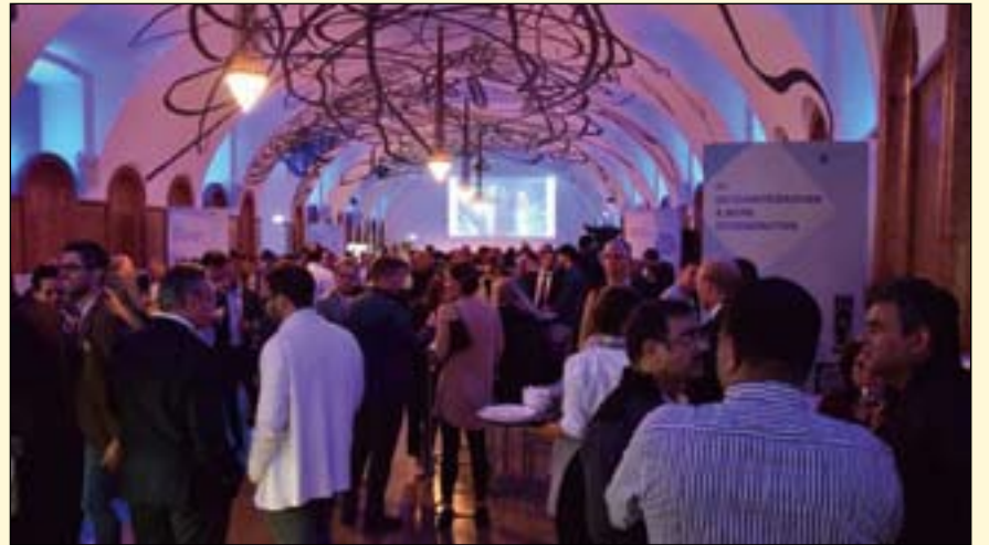
在维也纳的Hofstallung，350名牙科专业人员参加了骨再生基金会举办的聚会，来进行学术交流和人际沟通。