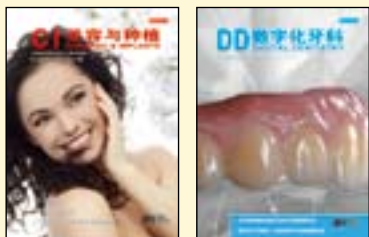
《美容与种植》 《数字化牙科》