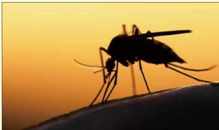
研究者希望利用三氯生的抗菌作用对抗疟疾这种蚊虫媒介传播的疾病。

叮咬人类时，感染疟原虫的蚊子通过其唾液将疟原虫传播至人类血液中。这些寄生虫转移至肝脏，生长成熟并进行繁殖，之后离开肝脏并劫持红细胞，在红细胞内继续繁殖，扩散至全身。