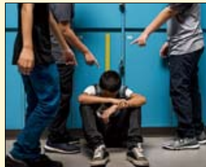
青少年夜磨牙症状可能与校园欺凌行为有关。

这项研究名为“青少年校园语言欺凌与患夜磨牙可能性是否存在联系”，发表在《口腔康复》杂志上。DT