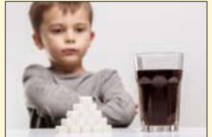
含糖饮料因儿童频繁饮用并对口腔健康有不良影响，一直被牙科业界热烈讨论。英国牙科学会、牙科业界以及商业联盟等共同呼吁政府，向世界范围内销售高糖饮料的公司作出适当的回应。

根据可口可乐欧洲分部的市场研究数据分析，半数英国民众计划观看今年的世界杯。他们预计89%的目标客户会在家观看