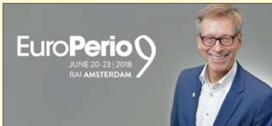
Søren Jepsen教授是欧洲牙周病学会前任主席，以及 EuroPerio9的科学主席。

关于此次学术盛宴的详细信息可访问： www.efp.org/europerio9/programme/scientific 。DTI