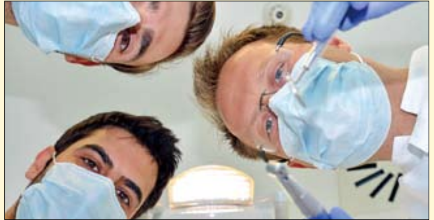
心理学家和牙医已经成功使用非药物方法来减轻牙科治疗中的精神压力——一种很多人都有的恐惧。