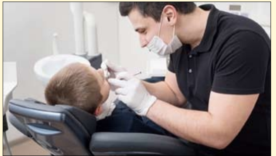
使用二氟化银是一种低成本阻止龋齿生长的方法，但不能修复龋齿。

黑染。Schroth正在与加拿大马尼托巴省的儿童医院研究所合作进行这项研究。目前，他在Mount Carmel诊所和ACCESS市中心与35名孩子一起工作。DT