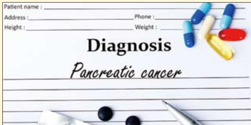
研究人员刚刚发现, 与牙周炎相关的主要毒力因子细菌酶也出现在胃肠道的恶性肿瘤中, 例如在胰腺癌中。

全身性炎症会促进口腔细菌及其毒力因子在身体其他部位的传播。他们指出, 牙周炎的预防和早期诊断对于患者的口腔健康和全身健康都是非常重要的。