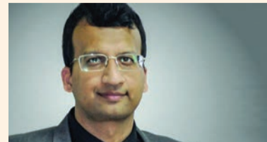
Secondo Rajiv Saini, relatore dell'IDEC, occorre concentrarsi maggiormente sulla salute orale, nei paesi in via di sviluppo e sull'educazione orale dei bambini.

Specializzato in Parodontologia e implantologia orale, Rajiv Saini è un docente appassionato di entrambe le specialità. Direttore dell'International Journal of Experimental Dental Science e del Journal of Periodontology and Implant Dentistry, alla vigilia della sua conferenza all'IDEC 2017 di Jakarta sul legame tra igiene orale e salute sistemica, è stato intervistato da Dental Tribune Online su alcuni temi significativi quali la conoscenza dei pazienti, le aspettative di cura e il cambio di ruolo dell'odontoiatria.