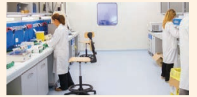
Ricercatori ospedale Bambino Gesù - Roma.

tologiche. A seconda delle forme, può causare la morte nel 10-30% dei casi. Al Bambino Gesù vengono seguiti circa 10 piccoli pazienti l'anno. «Avevamo intuito che l'esagerata attivazione di alcune cellule del sistema immunitario fosse la causa della malattia, ma