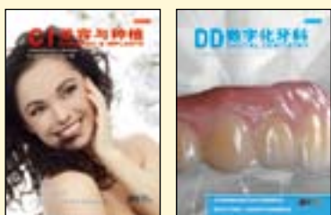
《美容与种植》 《数字化牙科》