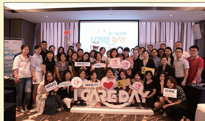
“iCARE Day”主题活动嘉宾合影照

服务管理工作的过程中，感觉到当今社会之浮躁尤其需要提倡服务的精神，来提升整个口腔行业对服务质量的重视，让专业技术人员获得尊重。因此创建一个服务品牌的想法在我心中油然而生，我希望通过iCARE的品牌，传递一种“care”的精神与服务的理念，来汇集更多价值观相同的从业者。