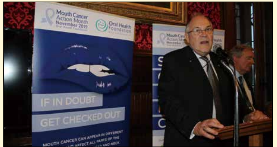
在发起“口腔癌行动月”的活动中，演讲者鼓励进行口腔癌筛查检查，以提高人们对口腔癌的认识，并提高生存率。