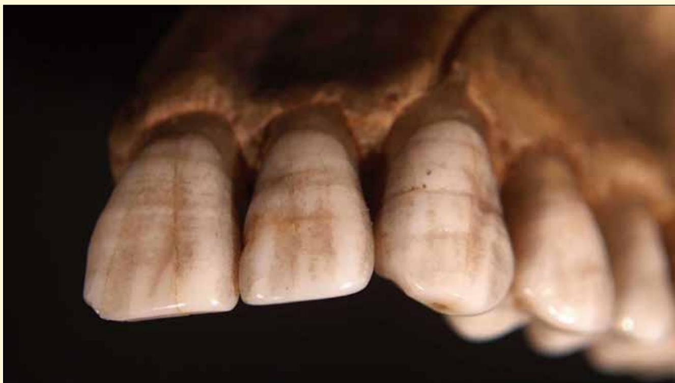
最新研究将儿童时期营养不良和健康状况不佳的牙釉质发育不全作为性别平等评价指标。