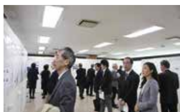
研究者によるポスター発表