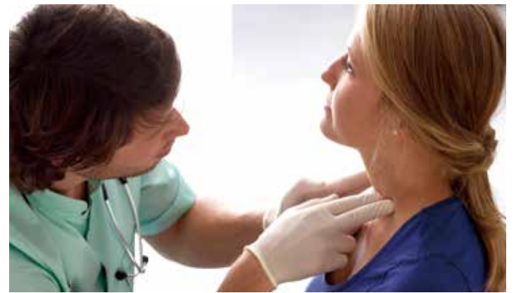
米国の最新研究において、リンパ節転移比率は口腔癌の再発および死亡のリスクを示している可能性があることが分かった

全臨床研究参加者において術中に摘出されたリンパ節は中央値で29個であった。切除リンパ節の約9%が癌陽性であった。これは、一部の患者でLNRが10%を超える一方で、LNRが特に低い患者や、ゼロの患者もいることを意味する。本試験の結果、LNRが10%を超える患者はLNRが10%未満