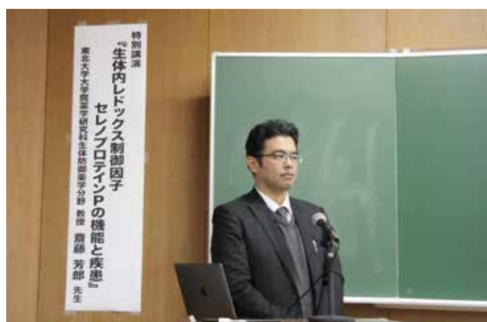
東北大の齋藤芳郎教授による講演が行われた