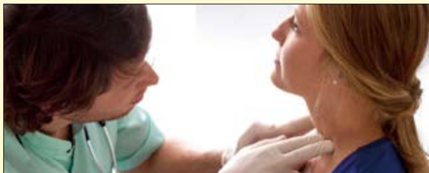
美国最近的一项研究发现，淋巴结比率可能预示了口腔癌复发和死亡的风险。

这项题为“淋巴结比率与口腔癌患者复发和生存预后之间的关系”的研究于2018年11月15日在线发表在《JAMA耳鼻喉-头颈外科学》杂志上。DT