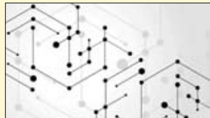
在一项临床试验中，加州大学洛杉矶分校(UCLA)领导的一个小组使用嵌有纳米金刚石——微宝石的生物材料来帮助组织愈合。

该研究题为《嵌入纳米金刚石的热塑性生物材料的临床验证》，于2018年10月23日在《美国国家科学院院报》上发表。DT