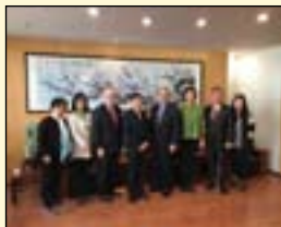
到访中华口腔医学会

1月9日与11日，访问团还到访了北京多家代表性的高端口腔诊所，以及世界牙科培训中心，并向诊所负责人详细介绍美国OSAP的情况，同时了解到连锁诊所，以及