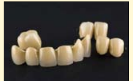
日内瓦大学的研究人员发现，金属烤瓷仍比氧化锆烤瓷更能呈现出较好的效果。

了全文分析，结果有19篇关于种植体支持的FDP的研究符合标准。这些标准包括：平均至少三年的随访和在随访时对患者进行临床检查。