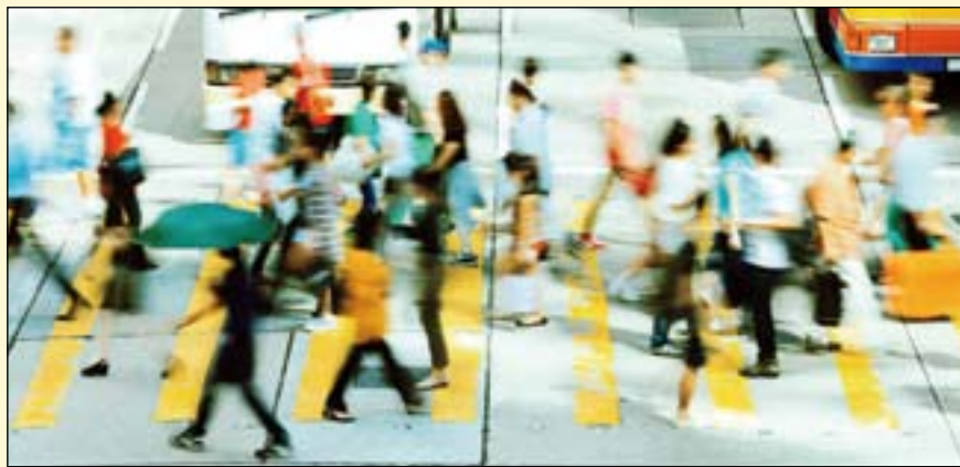
由特朗普总统于12月11日签署的一项新法案近期由国会通过, 旨在改善那些医疗服务短缺地区的人群获得口腔保健的机会。

该法案由众议员罗宾·凯利 (D-伊利诺伊州第二区) 和众议员迈克·辛普森 (R-爱达荷州) 提出, 最初于