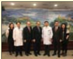
到访北京大学口腔医院