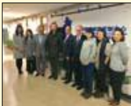
到访中国疾病预防控制中心