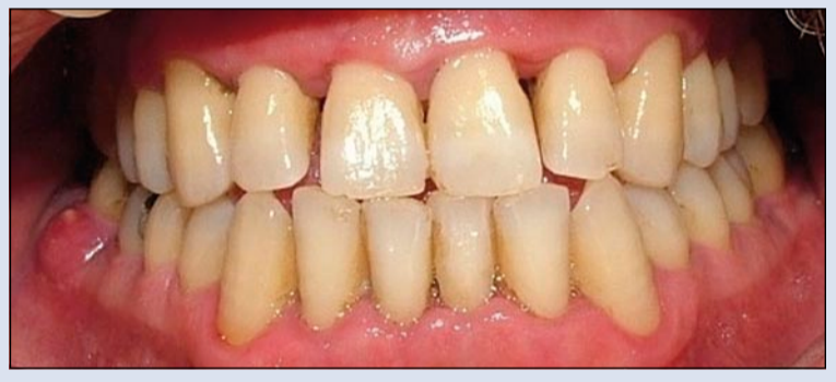
Fig. 1 - Parodontopatia.

È oggi consuetudine primaria diffondere le norme in merito alla disinfezione del cavo orale, visti i rischi di patologia associati alla comparsa di malattie conclamate nel distretto odontostomatologico. In genere è buona regola utilizzare il protocollo di disinfezione orale mediante presidi appropriati, che abbiano come priorità quella di abbassare la carica batterica a una percentuale dell'80%; ciò può essere effettuato mediante delle procedure già sperimentate e standardizzate secondo linee guida precise. In genere, la disinfezione si attua su pazienti affetti da patologie croniche (istoflogosi) come parodontopatie (Fig. 1), ma anche su soggetti affetti da