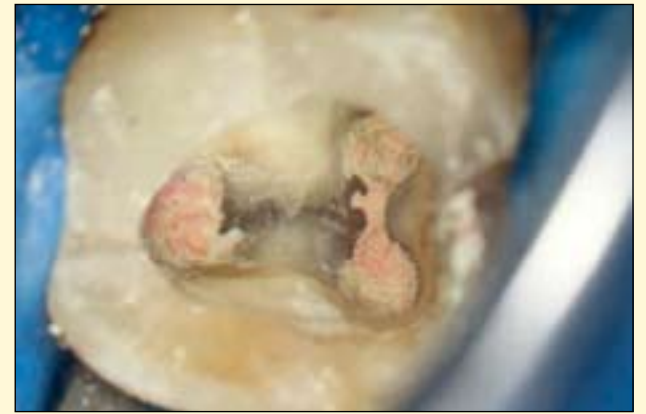
图6: 用牙胶和MTA-FILLAPEX充填后的根管。