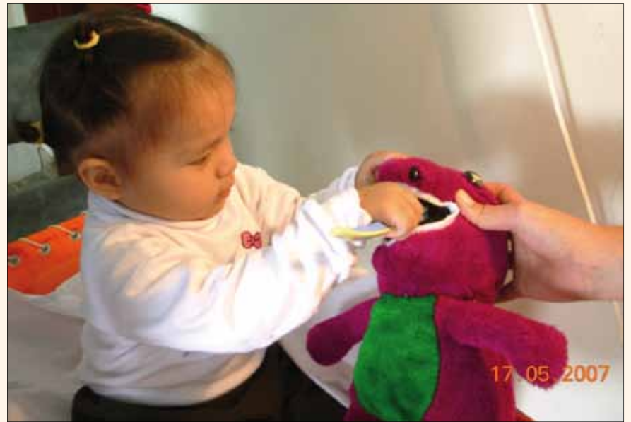
Fig. 1. Un bebé cepilla a un muñeco en el consultorio dental.

2. Cirujano Dentista, Maestro en Salud Pública. Asociado Fundador de la Asociación Peruana de Odontología para Bebés. Profesor de la EAP de Estomatología de la Universidad Alas Peruanas de Lima (Perú). Autores del libro «Odontología para Bebés. Fundamentos teóricos y prácticos para el clínico», Ed. Ripano.