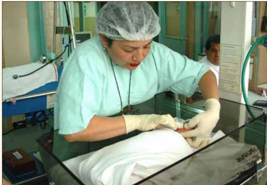
Fig. 2. Primera limpieza bucal en el recién nacido realizada en neonatología.