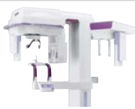
Hyperion X7 Panoramic Imager