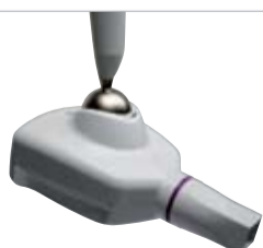
RXDC HyperSphere+ High frequency X-ray unit

Εκθεσιακό Κέντρο Expo Athens, 4 - 6 Νοεμβρίου 2011 Αίθουσα 6 • ΠΕΡΙΠΤΕΡΟ Β2