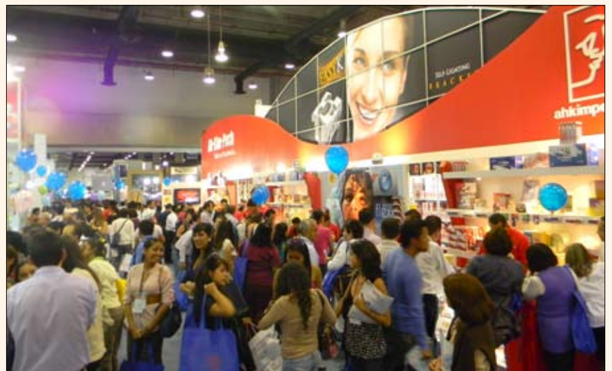
El stand de la compañía de productos de ortodoncia Ah Kim Pech estuvo siempre lleno.