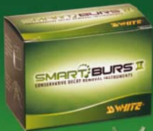
Assortment Pack (Order #52003)

SMARTBURS® II CONSERVATIVE DECAY REMOVAL INSTRUMENTS