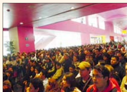
Una nutrida asistencia se congregó durante la inauguración de la mayor feria dental de México.