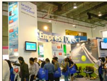
El concurrido stand de Ivoclar, que distribuye también las piezas de mano y contraángulos de W&H.