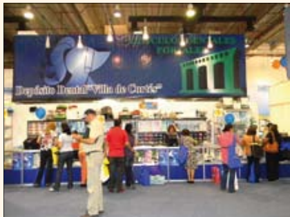
El Depósito Villa de Cortés, una de las mejores fuentes de México para productos de compañías como SS White, American Orthodontics, VIPI, Inibsa o 3M.