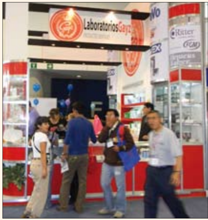
Uno de los principales distribuidores de México, Laboratorios Gayz, tiene las líneas de FGM, Cavex, Ritter o Woodpecker.