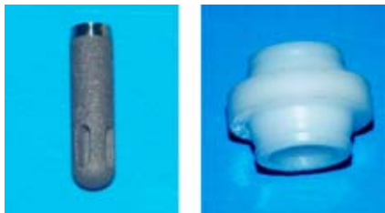
Figuras 9 y 10

realizar una PPF uniendo el implante y el diente como se realizó en este caso, o como la Figura 4, donde el fracaso en la osteointegración de uno de los implantes implica varias alternativas: reponer el implante perdido y realizar una PPF sobre los implantes y una PPF sobre la dentición natural o no reponer el implante y realizar una prótesis que ferlice en arco los dientes y los implantes como se observa en la Figura 5, son muy frecuentes en la práctica diaria. Por ello consideramos fundamental establecer unos criterios que nos permitan tomar la decisión adecuada para cada caso determinado.