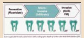
Εικ. 6 Η πρώτη θεραπεία για να γεφυρωθεί το κενό μεταξύ πρόληψης και αποκατάστασης.