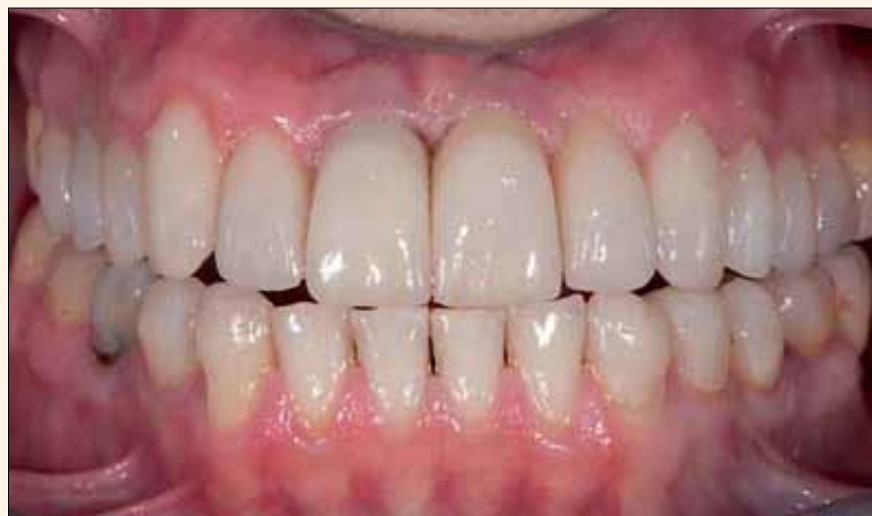
Figura 12. Postoperatorio de restauraciones de contorno completo unidas a los dientes posteriores y anteriores incisales en capas, realizado con IPS e.max HT.

te puede afectar directamente la flexión de los dientes y la concentración de la tensión. Existe un gran potencial de subjetividad en cualquier evaluación observacional de las condiciones clínicas; sin embargo, es necesario evaluar el potencial de flexión de cada diente a ser restaurado. Una asignación subjetiva de riesgo bajo, medio o alto de flexión se