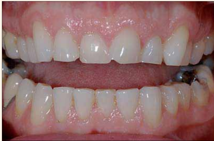
Figura 9. Postoperatorio de caso que necesitó un alargamiento significativo. Riesgo medio de flexión y tensión desfavorable y parte del sustrato sería dentina. Por lo tanto, los materiales de la Categoría 1 se eliminaron como opción.