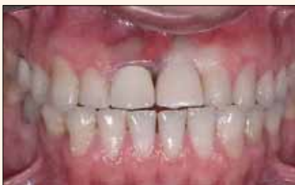
Figura 11. Postoperatorio de un caso en que el paciente rechazó la cirugía y ortodoncia. El objetivo del tratamiento fue realizar una preparación mínima y usar un material resistente, debido al riesgo de medio a alto en cada zona, aparte del mantenimiento del sellado.