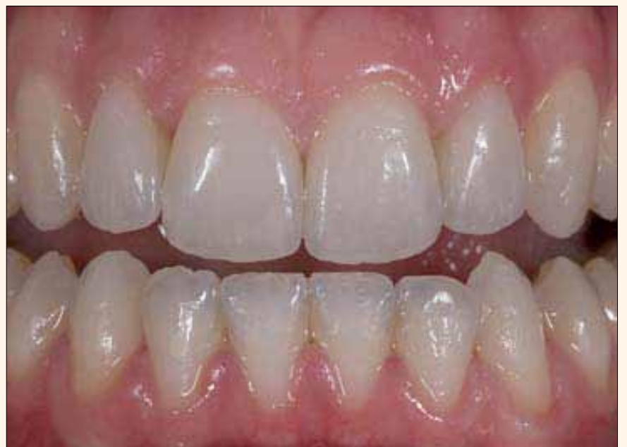
Figura 6. Postoperatorio a dos años de restauraciones muy conservadoras de porcelana Categoría 1, unidas utilizando porcelanas VITA VM.