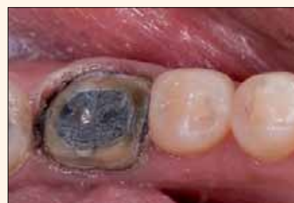
Figura 4. Preparación con sustrato y márgenes subgingivales pobres, donde el mantenimiento del sello será difícil. Están indicadas cerámicas o metal-cerámica de alta resistencia.