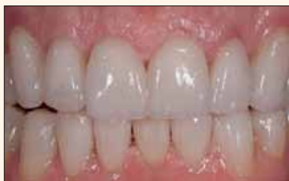
Figura 10. Postoperatorio del mismo caso utilizando materiales de la Categoría 2, en este caso VITABLOCS Mark II, donde se aplicó un mínimo de capas de porcelana en el tercio incisal.