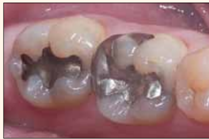
Figura 7. Preoperatorio de una incrustación en el diente 18 y onlay en el 19.