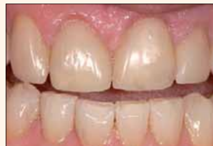
Figura 2. Agrietamiento excesivo del esmalte, filtraciones y tinción de los dientes. Riesgo medio-alto de flexión, tensión y tracción. El sustrato dependerá de la preparación.