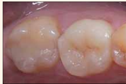
Figura 8. Postoperatorio en el que se utilizó IPS e.max HT sin capas.