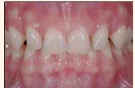
Figura 3. Profunda sobremordida en la que el riesgo de tensión y tracción sería al menos medio. La unión con porcelana requeriría el mantenimiento del esmalte y una estrategia oclusal para reducir el apalancamiento de los dientes.