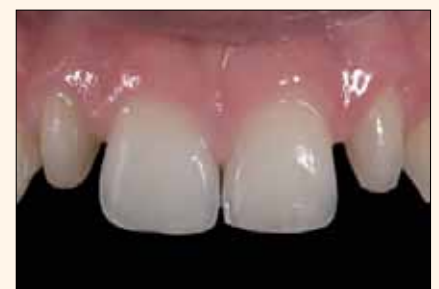
Figura 5. Preparación mínima antes de unir con porcelana.