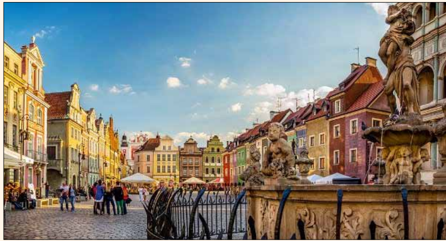
Poznan es una ciudad dinámica de unos 650.000 habitantes situada a medio camino entre Berlín y Varsovia, con fácil acceso por aire, tren y carretera, y numerosas atracciones turísticas.

La información publicada por Dental Tribune International intenta ser lo más exacta posible. Sin embargo, la editorial no es responsable por las afirmaciones de los fabricantes, nombres de productos, declaraciones de los anunciantes, ni errores tipográficos. Las opiniones expresadas por los colaboradores no reflejan necesariamente las de Dental Tribune International. ©2014 Dental Tribune International. All rights reserved.