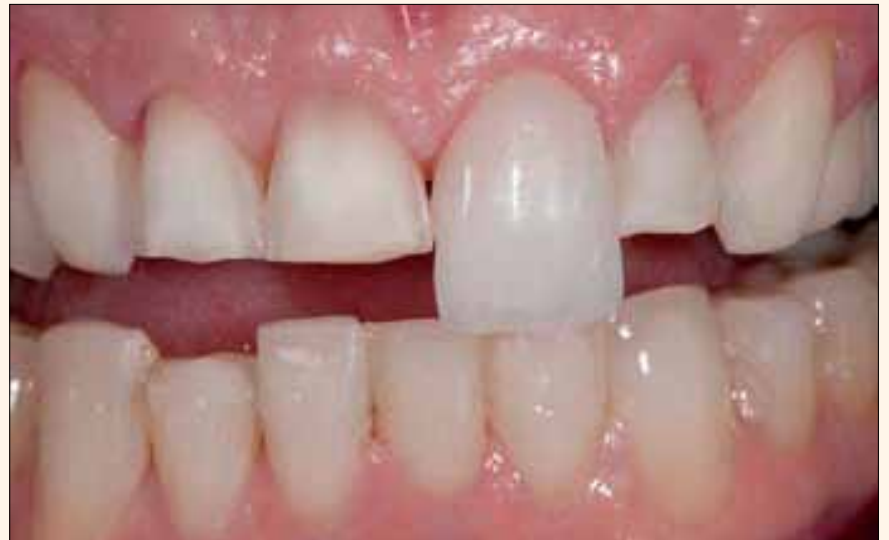
Figura 1. Se observa una significativa exposición de la dentina a lo largo del espacio a restaurar en el diente preparado, riesgo medio de flexión y tracción, y el espesor de la restauración debería ser de por lo menos 0,9 mm.

Las cerámicas de vidrio tienen los mismos requisitos de espacio que la porcelana para obtener un cambio de color efectivo. Sin embargo, los autores opinan que es difícil trabajar con esta categoría y producir los mejores resultados estéticos cuando el material es menor de 0,8 mm de espesor. Las coronas de cerámica sin metal de alta resistencia requieren un espesor de 1,2 a 1,5 mm, dependiendo del color del sustrato, y las de metal-cerámica necesitan un espesor de al menos 1,5 mm para crear una estética realista. Teniendo esto presente, un diagnóstico basado en la posición del diente y el cambio de color deseado debe dirigir la planificación del tratamiento, así como la decisión final con respecto a