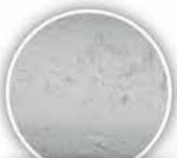
Paltop Advanced (x500)