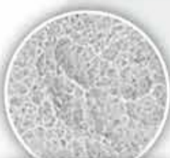
Paltop Advanced (x5.000)

Η ανάλυση EDX (Energy Dispersive X-ray Spectroscopy) δείχνει την παρουσία μόνο των τυπικών στοιχείων που περιέχονται στο Τιτάνιο Grade 5. Κανένα άλλο στοιχείο δεν ανιχνεύτηκε στην επιφάνεια των εμφυτευμάτων Paltop.