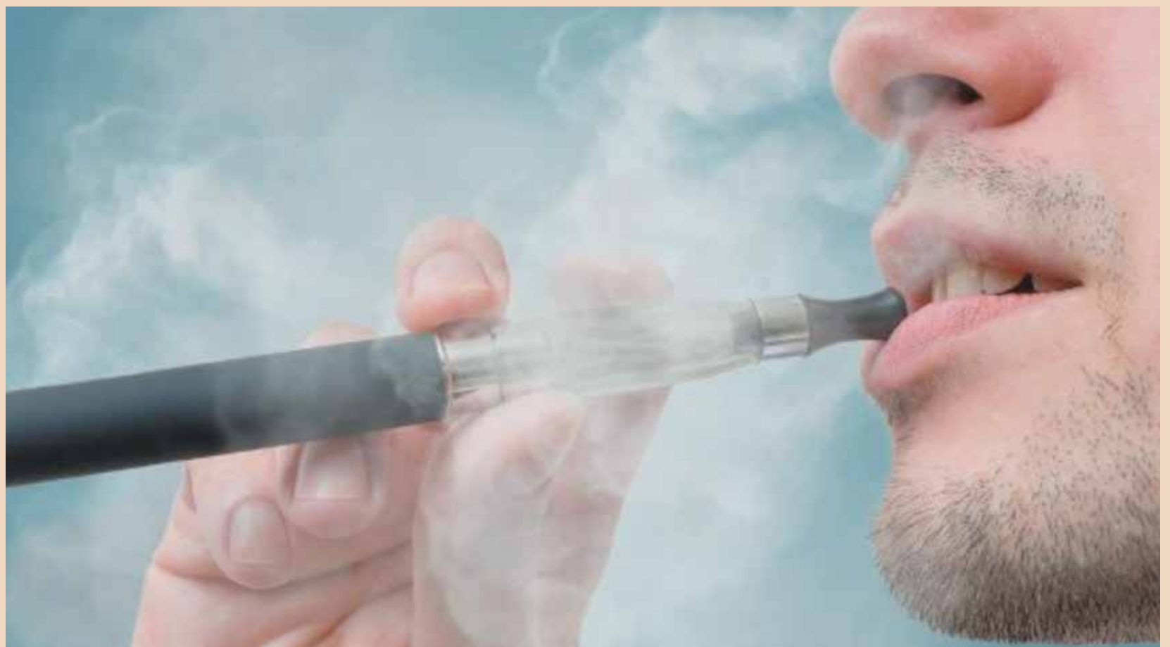
Εικ. 1 Δύο ερευνητικές ομάδες από τις ΗΠΑ και τον Καναδά βρήκαν πως ο καπνός του ηλεκτρονικού τσιγάρου είναι επιβλαβής για τους ουλικούς ιστούς και μπορεί να αυξήσει τον κίνδυνο περιοδοντικής νόσου.

Για να προσομοιωθεί η κατάσταση στο στόμα ενός ανθρώπου κατά την εισρόφιση του καπνού, οι Καναδοί ερευνητές τοποθέτησαν ανθρώπινα επιθηλιακά κύτταρα σε ένα μικρό θά-