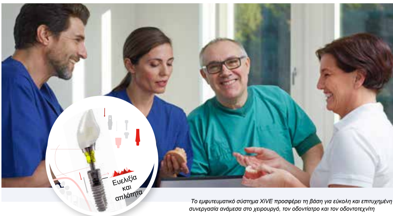
Το εμφυτευματικό σύστημα XiVE προσφέρει τη βάση για εύκολη και επιτυχημένη συνεργασία ανάμεσα στο χειρουργό, τον οδοντίατρο και τον οδοντοτεχνίτη