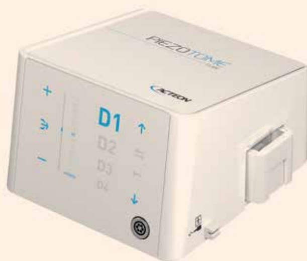
Compacto y potente, Piezotome CUBE es el motor quirúrgico ultrasónico más avanzado del mercado.

El generador de energía ultrasónica uti-