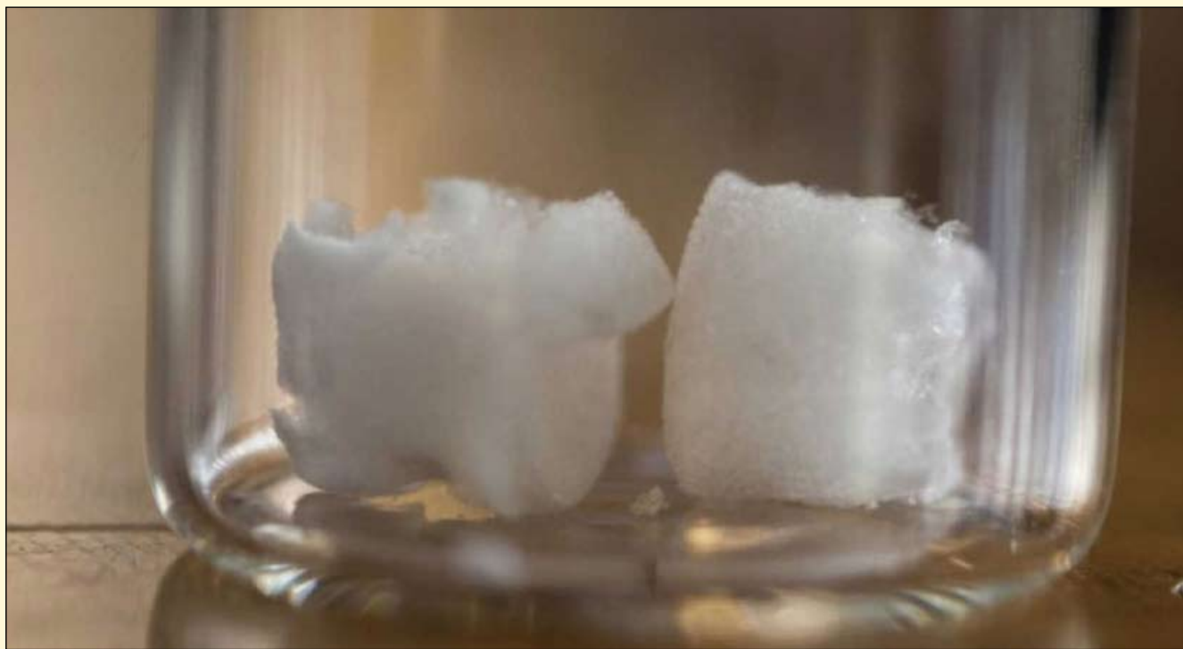
研究人员已经开发出一种新的来源于植物纤维素的骨再生材料，它可在未来用于牙科种植体。

“这些研究发现首次表明，在实验室环境中，纤维素纳米晶体制成气凝胶可以支持新骨的生