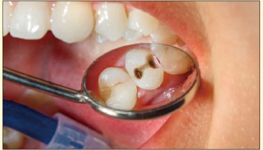
多伦多大学的研究人员发现，人类的免疫系统对龋齿的患病中起着一定的作用。