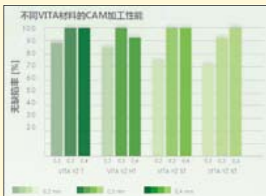
图4: 不同VITA YZ氧化锆材料的CAM加工性能。