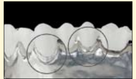
图1b: 使用对比品牌氧化锆制作的冠桥修复体结晶烧结后, 在模型上试戴并检查就位情况。

试验方法: 使用计算机辅助切削设备制作7单位长桥, 并按照厂家的标准操作流程进行结晶烧结, 烧结后在切削氧化锆模型上就位。