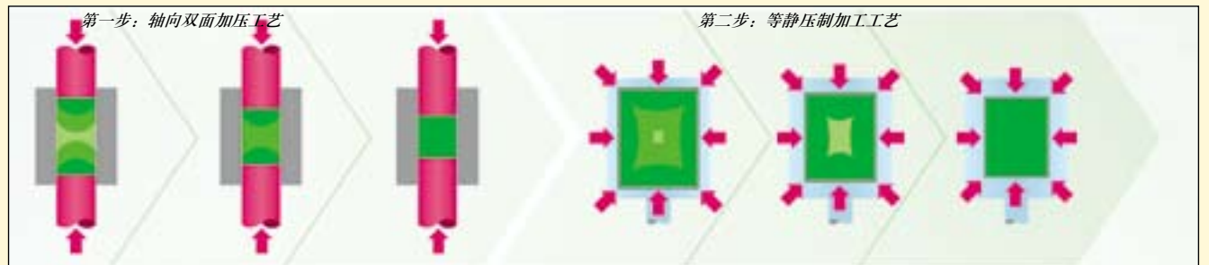
图2: VITA YZ系列氧化锆材料的冲压工艺原理图。

试验方法: 使用计算机辅助切削设备制作7单位长桥, 并按照厂家的标准操作流程进行结晶烧结, 烧结后在切削氧化锆模型上就位。