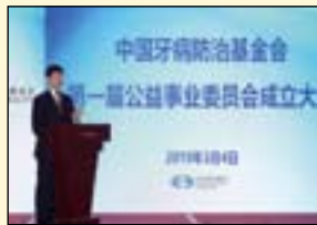
中国牙病防治基金会副理事长、解放军总医院口腔医学中心主任刘洪臣做公益事业委员会报告