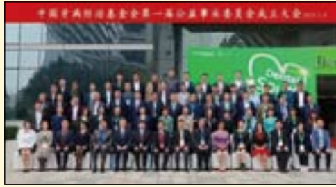
中国牙病防治基金会公益事业委员会委员合影

为集合口腔医学相关领域的社会资源和精英力量，搭建合作共赢的公益平台，经中国牙病防治基金会全体理事会议审议通过，成立公益事业委员会。旨在面向社会，以需求为导向，开展信息技术优化继续教育方式，加大对基层和偏远地区扶植力度，全面提高基层口腔医务人员的能力和技术水平。落实推动和发展口腔医学领域的公益事业，发挥专业资源和人才优势，加强实用型、复合型人才培养培训，引领口腔健康服务业优质发展。推动口腔健康制造业创新升级，推动科技成果转化和适宜技术应用。促进新技术、新材料的应用与推广等等。DT