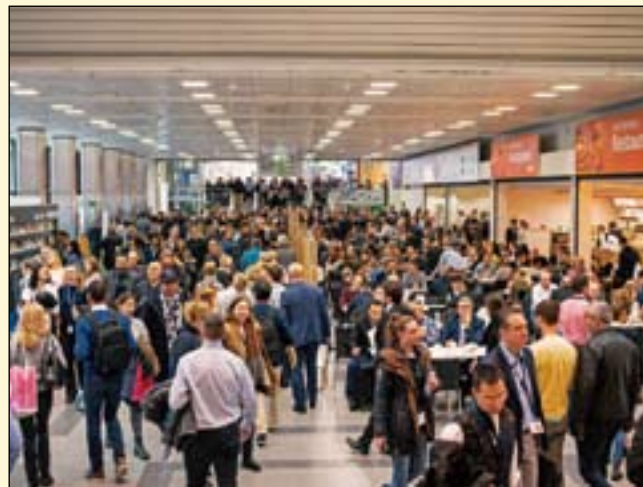
人流如织的展会现场