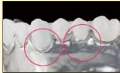
图1a: 使用VITA YZ T制作的冠桥修复体结晶烧结后, 在模型上试戴并检查就位情况。