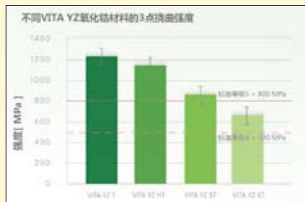
图6: 各类VITA YZ氧化锆材料的三点挠曲强度。

测试方法: 每个系统制作六组相同设计的后牙桥, 使用通用实验设备对其进行断裂载荷试验。