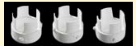
图3: 使用VITA YZ氧化锆材料制成的齿形样品, 壁厚分别为0.2mm, 0.3mm, 0.4mm (从左至右)。

测试方法: 使用CAM加工不同的粉体氧化锆材料, 形成壁厚分别为0.2mm, 0.3mm, 0.4mm的样本 (每个样本有四个齿壁, 如图)。