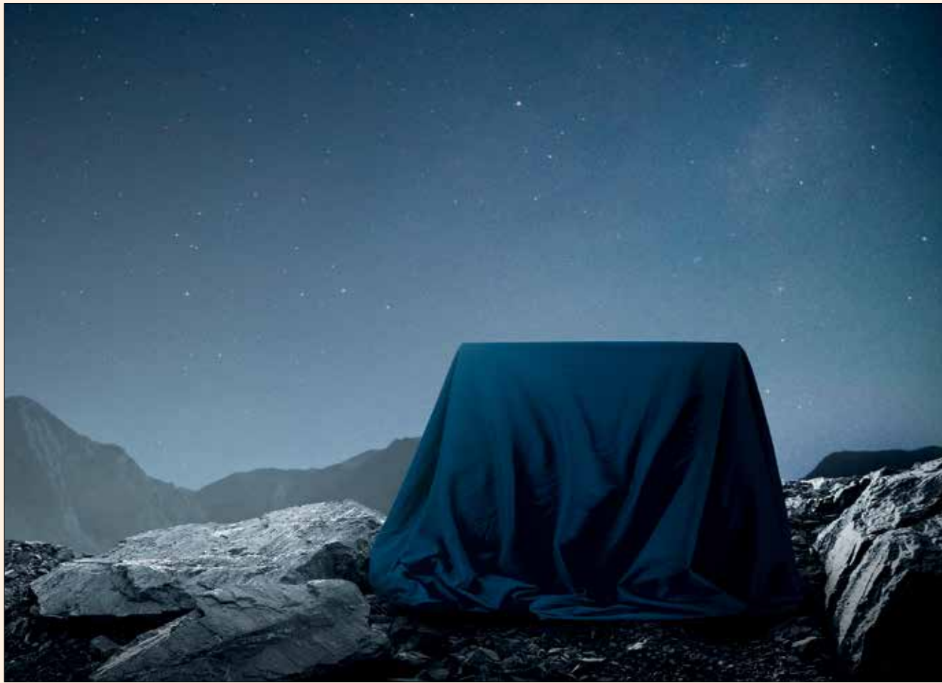
Amann Girrbach desvelará su secreto en la IDS 2019.