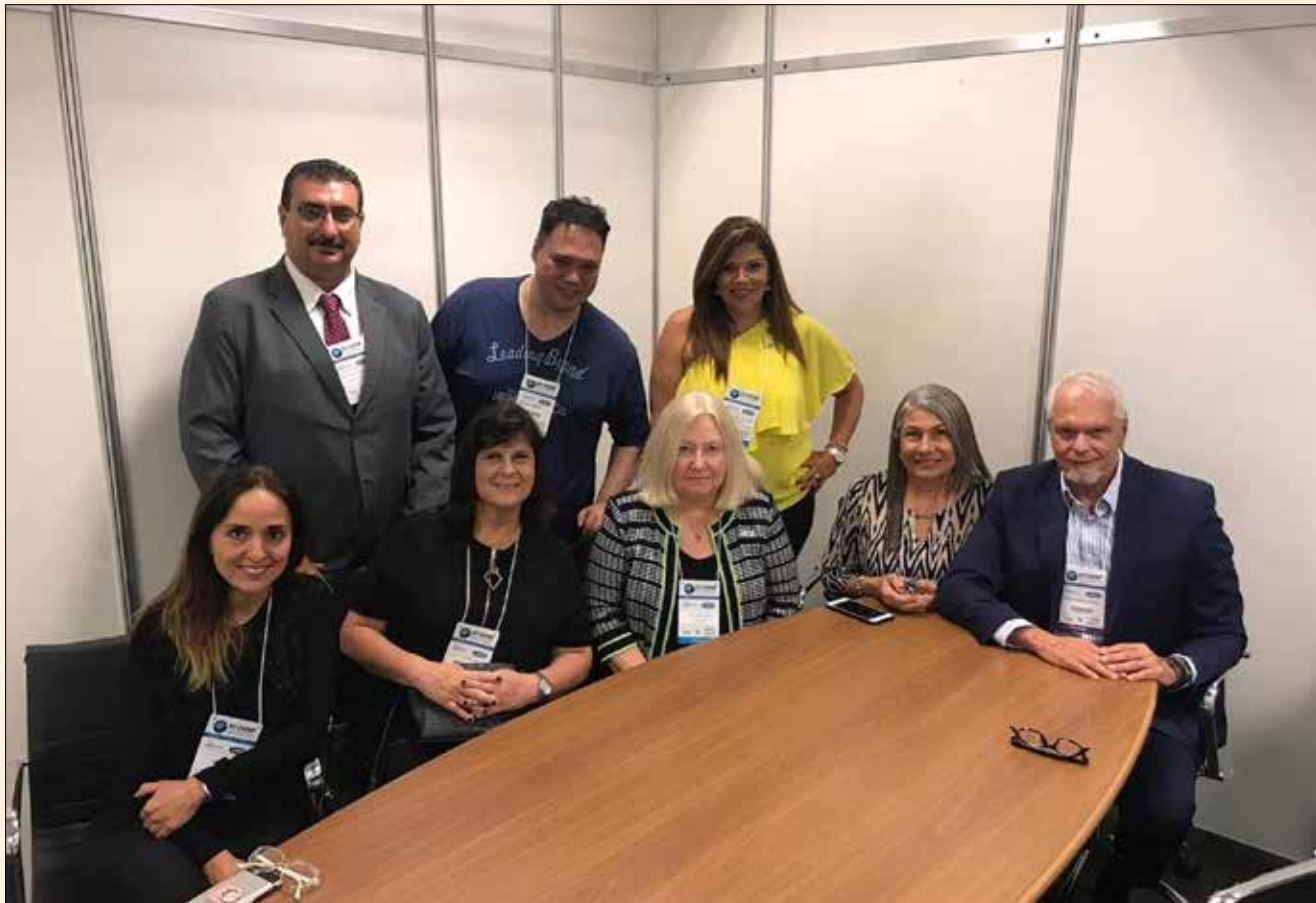
Los representantes de la organización regional de países latinoamericanos en FDI (LARO), durante la reunión donde emitieron un comunicado censurando fuertemente el documental.

La comunidad rebate las afirmaciones del documental "Root Cause"