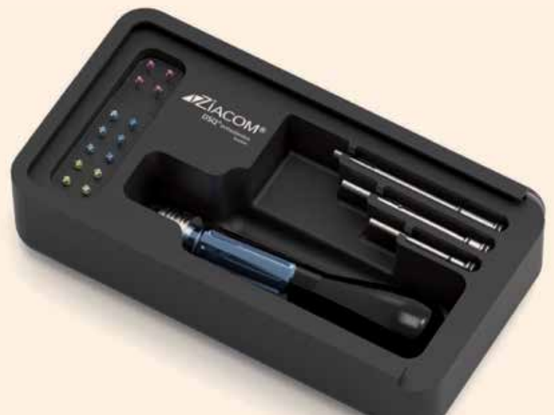
El elegante kit del sistema de microimplantes DSQ-Ziacom.