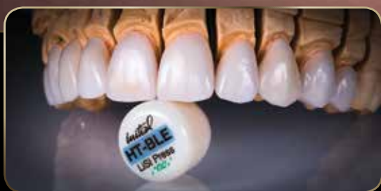
Restauraciones: Cortesía de Bill Marais, RDT & Rick Canizares, DMD

G-CEM LinkForce™ cemento de resina optimizado para ser utilizado con GC Initial™ LiSi Press