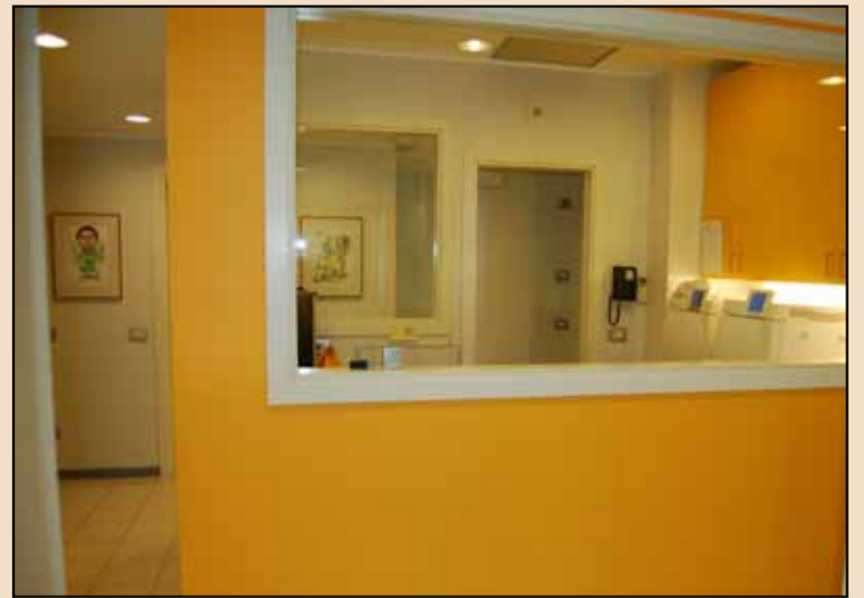
La sala di sterilizzazione.

A questo punto, chiedo al professore quale sia il "segreto" per ottenere ambienti così funzionali, dove niente è lasciato al caso: è sufficiente affidarsi a una società che si occupa di ristrutturazioni? La risposta è immediata. "È certamente fondamentale affidarsi a società specializzate e competenti, senza dimenticare però che è ne-