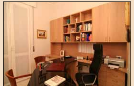
Lo studio privato.