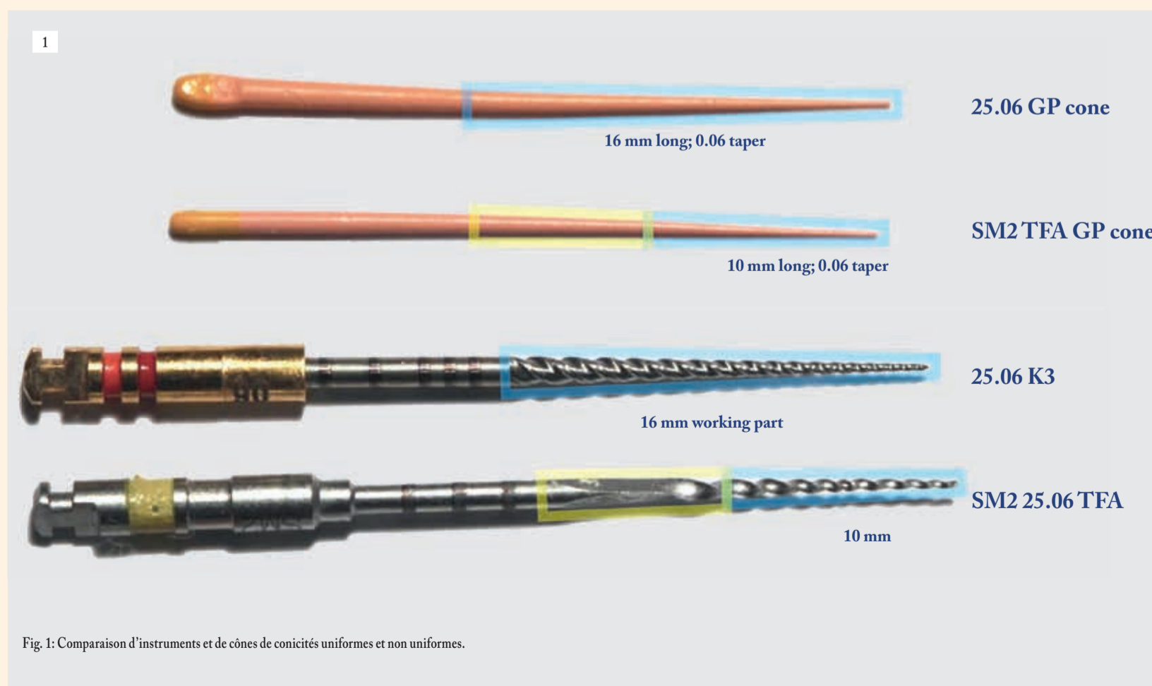
Fig. 1: Comparaison d'instruments et de cônes de conicités uniformes et non uniformes.

La meilleure et la plus simple solution consiste donc à choisir les cônes de G-P conçus pour la marque spécifique d'instruments NiTi utilisés, les cônes étant parfaitement adaptés à la conicité des canaux radiculaires préparés au moyen de ces instruments. On dispose ainsi de la garantie d'une obturation tridimensionnelle idéale et d'une résistance au retrait satisfaisante. Une lime K3XF permet toutefois aux cliniciens d'utiliser les deux types de cônes (cônes de conicité 0,04–0,06 ou cônes TF/