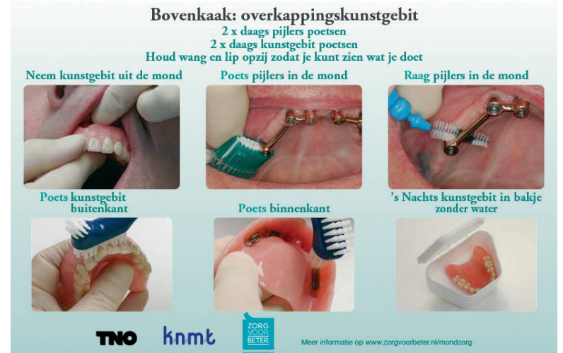
Poetsinstructiekaart voor oudere patiënten.

Daarnaast helpt de KNMT tandartsen hun praktijk zo goed mo-