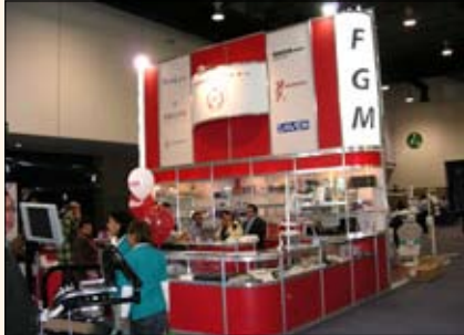
Laboratorios Gayz, distribuidor en México de las líneas de materiales de Cavex o de los blanqueadores de FGM, entre otros.