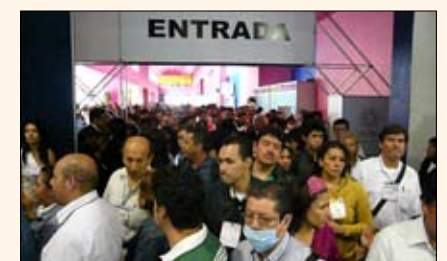
La expo tuvo una nutrida asistencia desde el primer momento, como se aprecia en la imagen.