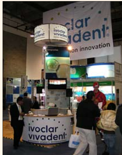
El polimerizador «bluphase» de Ivoclar Vivadent permite fotopolimerizar en múltiples indicaciones.