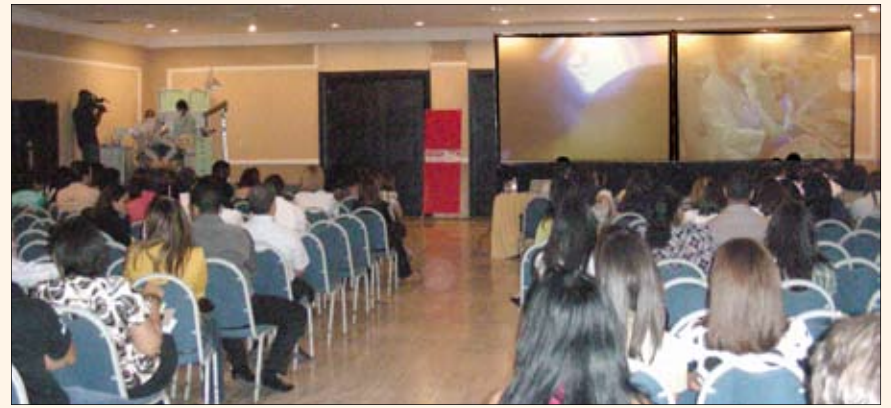
Durante un procedimiento de endodoncia filmado en vivo (izquierda), los asistentes observaron simultáneamente en pantallas de gran formato tanto los detalles como la técnica del especialista, explicada paso a paso por el mismo.

política de Estado de cada país. La propuesta, que aboga por una visión integral latinoamericana, ha sido recogida en la llamada Carta de Brasilia y en la página 20 ofrecemos más información. El congreso de la Asociación Odontológica Dominicana, la acción política de FOLA por el gremio a nivel continental y las reuniones de SOLA, Ofedo Udual y los Coordinadores de Salud Bucal de los gobiernos latinoamericanos apuntan claramente a una acción coordinada de todos los sectores de la odontología de la región para unir objetivos y lograr metas, todo lo cual está alcanzando aún