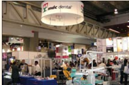
MDC Dental ha sacado al mercado su Max Print Machine, que dispensa cantidades exactas para preparar alginato y tomar impresiones dentales.