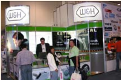
W&H ha dado en el clavo incorporando luz LED a las turbinas Alegra, que vienen con contraángulos, a sus instrumentos quirúrgicos o a su nuevo Piezo Scaler.