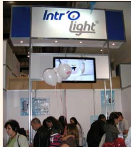
Las ingeniosas luces de la empresa mexicana Introlight son flexibles y se adaptan a una multitud de instrumentos quirúrgicos.