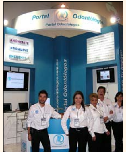
El equipo de Portal Odontólogos, la red online más eficiente de México, llega con sus mensajes a casi 20,000 dentistas.