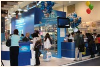
La compañía Oral B presentó en México su avanzada pasta dental Crest ProSalud, que se enfoca en múltiples áreas dentales.