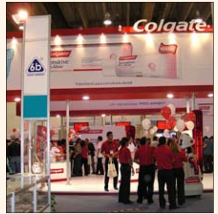
La pasta dental Colgate Sensitive Pro-Activ, con Pro-Argin, fue objeto de un número monográfico de investigación en el American Journal of Dentistry