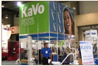
KaVo introdujo sillones con una amplia gama de movimientos a precios económicos.