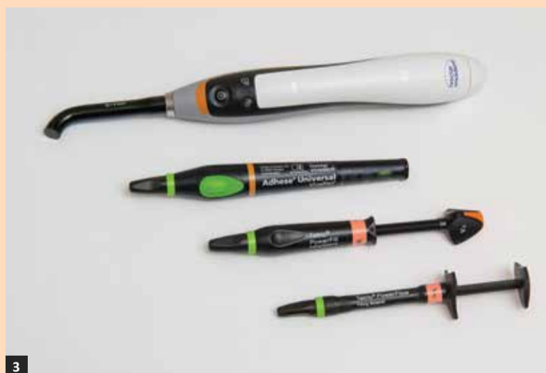
Slika 1: Bluephase PowerCure polimerizacijska lampa s Polyvision tehnologijom.