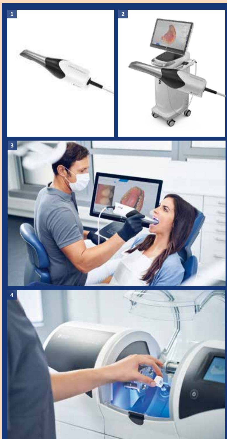
Slika 1: Primescan – novi intraoralni skener kompanije Dentsply Sirona koji digitalni otisak diže na novi nivo kvaliteta. • Slika 2: Zahvaljujući glatkim površinama Primescana i akvizicijskog centra, higijenski kritična područja koja se često teško čiste mogu se očistiti sigurno, brzo i jednostavno. • Slika 3: Digitalni otisci uz Primescan: jednostavnije, brže i preciznije nego ikad pre. • Slika 4: Novi dizajn glodalice CEREC MC XL.

Posetite www.dentsplysirona.com za više informacija o kompaniji Dentsply Sirona i njenim proizvodima.