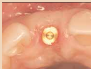
Fig. 1f: S-a utilizat o tehnică chirurgicală fără lambouri pentru a minimiza trauma țesutului.