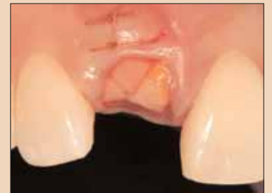
Fig. 1d: Grefă de țesut conjunctiv interpozițional așezată peste grefa alveolară și fixată cu suturi.