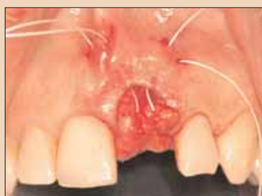
Fig. 2d: Sutura în bursă pe bucal și lingual utilizate pentru poziționarea grefei de țesut prin lamboul tunelului.