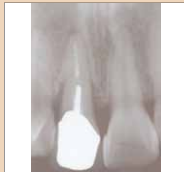
Fig. 1b: Pilon și miez nereușiți cu radiotransparență perl-optică.