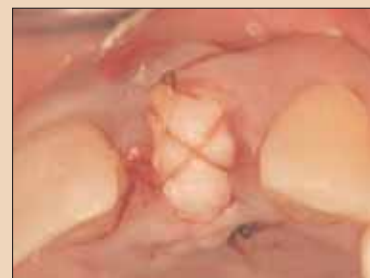
Fig. 3c: Sutura cu strat în cruce fixează grefa de țesut conjunctiv interpozițional peste creastă.