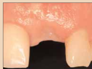
Fig. 2f: Deficit de țesut moale complet reparat în pregătirea pentru introducerea implantului ideal.