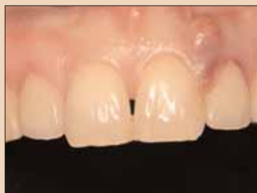
Fig. 3a: Absces endodontic cu fistulă bucală peste dintel nr. 10.