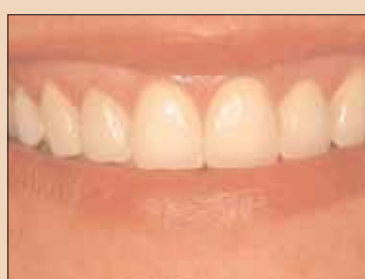
Fig. 3e: Radiografia restaurării finale cu implant reținut cu ciment susținut de punctul de sprijin personalizat.

implant și pentru a îmbunătăți arhitectura țesutului moale.