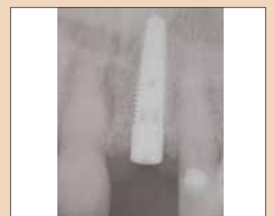
Fig. 2g: Radiografie postoperatorie a implantului în poziție ideală pentru restaurare.