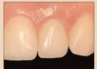
Fig. 3d: Estetică ideală de țesut moale obținută.