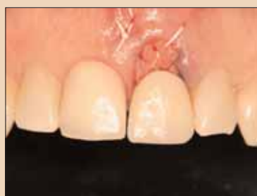
Fig. 2e: Loc prevăzută temporar cu dispozitiv detașabil utilizând tehnica ovate pontic.