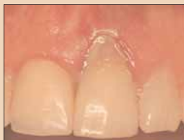
Fig. 2a: Absces parodontal grav secundar resorbției rădăcinii la dintel nr. 9.