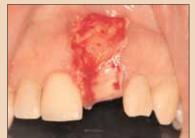
Fig. 2c: Grefă de țesut conjunctiv trasă peste creastă, demonstrând dimensiunea mare necesară pentru vascularizare.