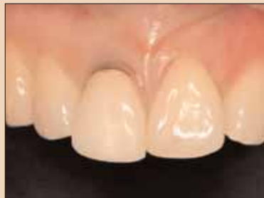
Fig. 1a: Prezentare clinică a unei restaurări nereușite cu carierea recurentă a dintelui nr.8.

Anterior s-au publicat strategii pentru controlul defectului de extracție, care furnizează algoritmi ce ajută la îndrumarea procedurilor de tratament cu implanturi imediat după extracția dentară. Acest articol prezintă trei rapoarte de cazuri clinice în care se utilizează aceste linii directoare și demonstrează beneficiile folosirii implanturilor de țesut mare, gros conjunctiv interpozițional împreună cu extracția dentară și conservarea locului, precum și în cursul introducerii implanturilor imediate, pentru a augmenta biotipul peri-