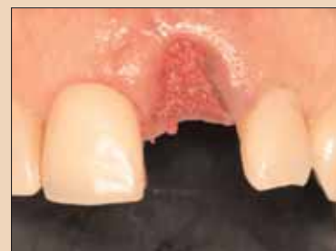
Fig. 2b: Conservarea locului utilizând grefa matricei osoase anorganice minerale și osoase demineralizate.