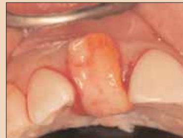
Fig. 1c: Grefă de țesut conjunctiv trasă peste creastă, demonstrând dimensiunea mare necesară pentru vascularizare înainte de introducerea sub lambourile tunelurilor.