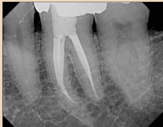
Figs. 3A-B: Canale calcificate tratate în modul descris.