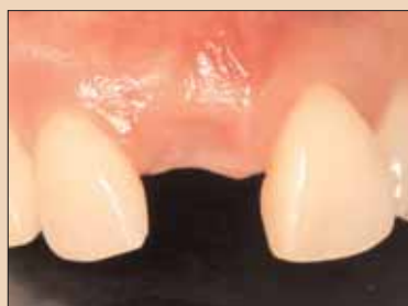
Fig. 1e: Augmentarea biotipului parodontal cu păstrarea marginii gingivale și a papilei favorabile.