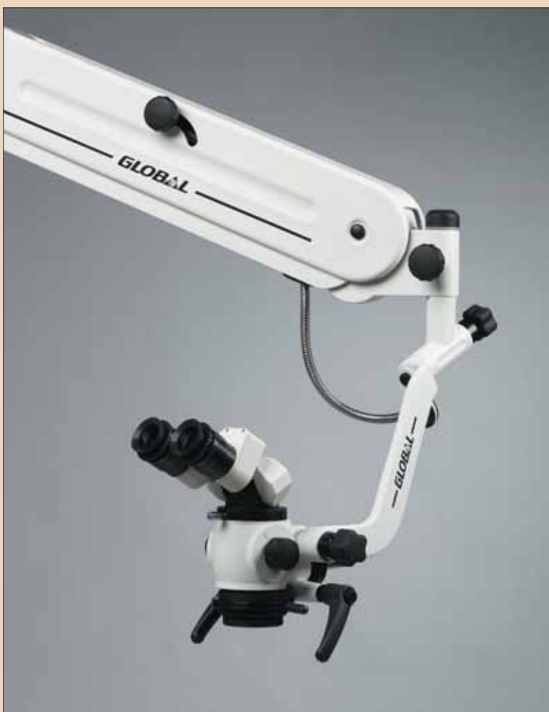
Fig. 1: Microscop chirurgical Global (Global chirurgicale, St Louis, MO, USA).

Un cititor mi-a trimis recent prin e-mail această întrebare: "Ai mai folosit un ac rotativ din NiTi 15 .02 (de exemplu, K3, Race sau Quantec) pentru a obține lungimea de lucru pe care ai fost în imposibilitatea de a o stabili cu ace de mână, de exemplu într-un canal MV2? Dacă da, care a fost experiența ta cu această tehnică?"