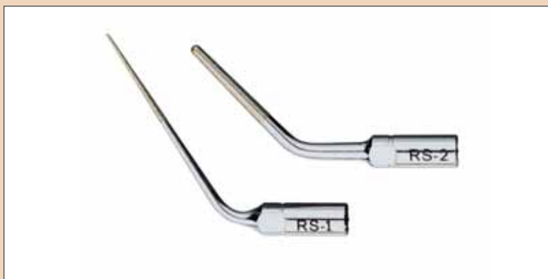
Fig. 2: Varfuri Red Star (SybronEndo, Orange, CA).

Răspunsul este relevant clinic și își găsește aplicații într-o gamă largă de instrumente și tehnici. Eu folosesc de obicei eficient și în condiții de siguranță instrumente K3 .02 conice rotative din nichel titan (RNT). Nu îmi fac probleme de risc de fractură ale K3, în ceea ce privește dimensiunile mici (No.15-20) și forma lor conică .02. Încrederea cu care afirm acestea și mai ales modul în care aceste instrumente sunt folosite necesită o explicație.