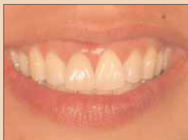
Fig. 1j: La un an de la operație rezultatele se dovedesc a fi stabile.