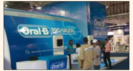
La nueva pasta dental Pro-Salud, considerada como un avance revolucionario por sus propiedades que impiden el crecimiento de bacterias en los cepillos, fue presentada por primera vez en Brasil por Procter&Gamble ( www.pg.com ).