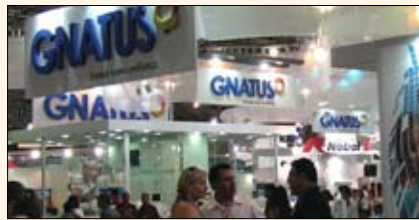
Gnatus ( www.gnatus.com.br ) presentó novedades como su Línea Syncrus HLX, un ultramoderno equipo que cuenta con sillón, unidad dental totalmente electrónica, reflector LED y unidad de agua.