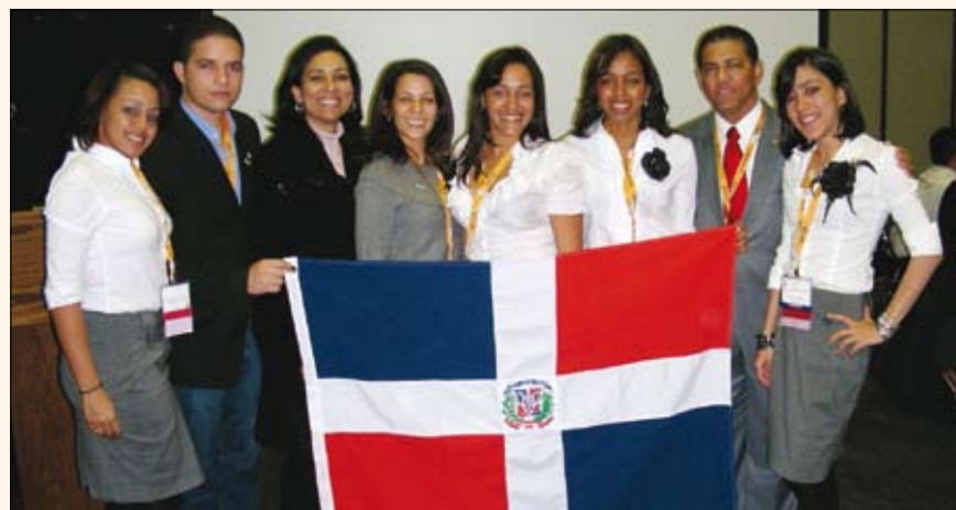
El contingente de estudiantes dominicanos que obtuvo el primer premio en el concurso de pósters en el congreso de Nueva York. El concurso es parte de un acuerdo de FOLA con el GNYDM para incluir conferencistas y estudiantes latinoamericanos en la feria.