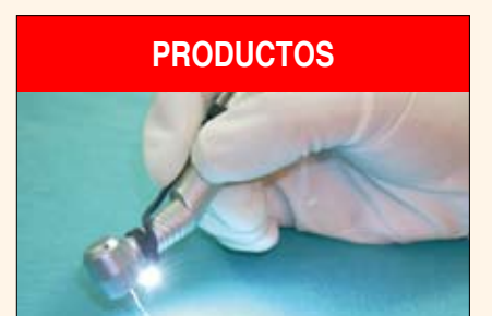
Novedades de Vita, E-WOO, Forestadent, e Introlight Paginas 28, 29 y 30