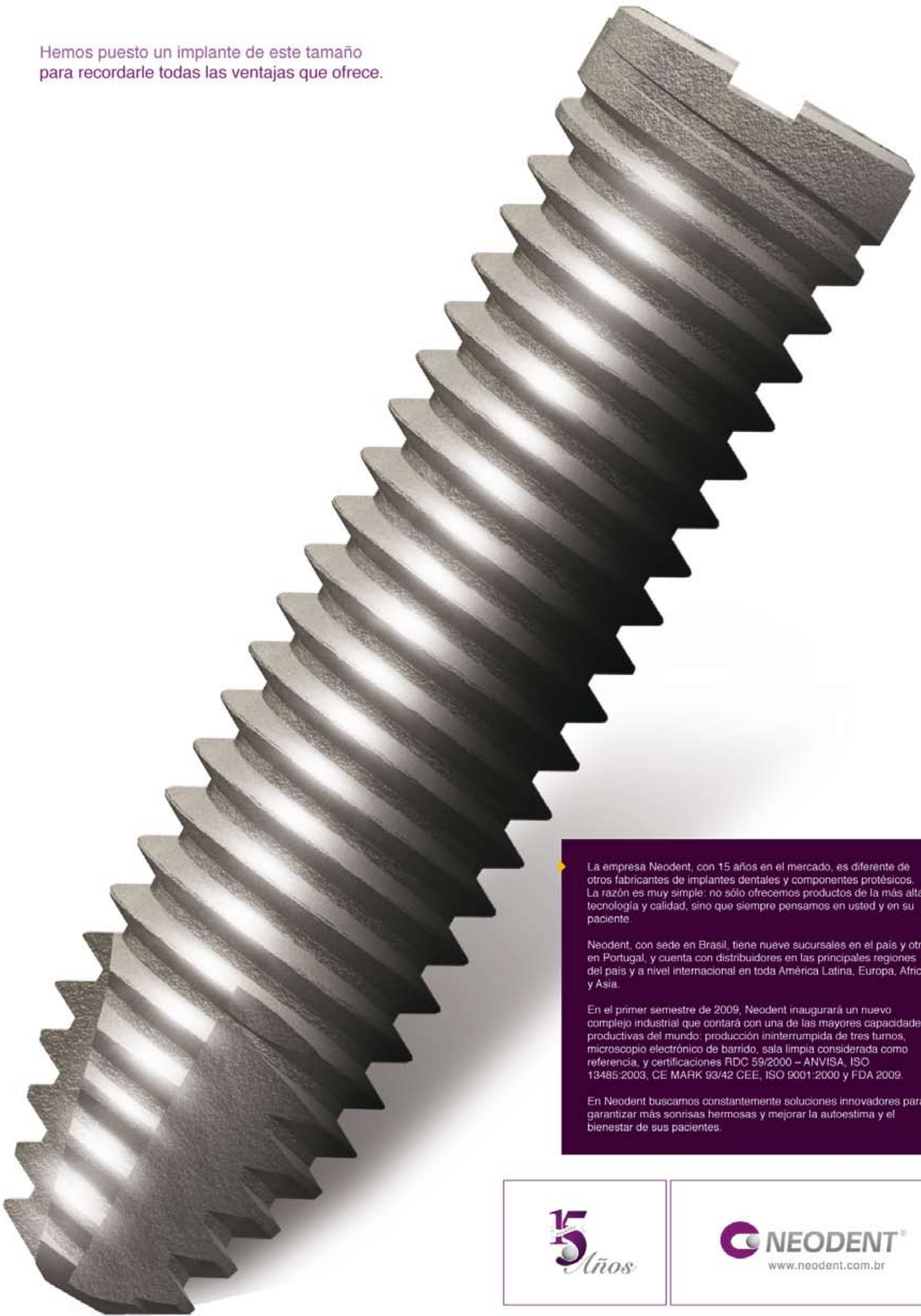
Imagem solamente ilustrativa

Hemos puesto un implante de este tamaño para recordarle todas las ventajas que ofrece.