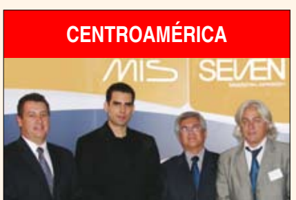
I Simposio Centroamericano de Implantes MIS Pagina 20