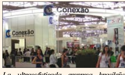
La ultrasofisticada empresa brasileña Conexao ( www.conexao.com.br ), especializada en sistemas de prótesis, anunció su 7º Simposio Internacional de Prótesis sobre Implantes, en el que participarán figuras como Henry Salama.