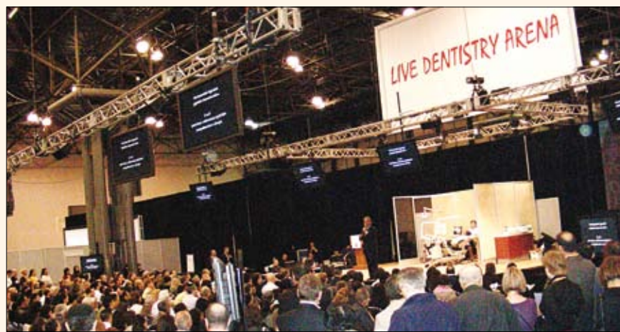
El gran teatro de cirugías en vivo atrajo a cientos de profesionales diariamente para presenciar los procedimientos quirúrgicos.