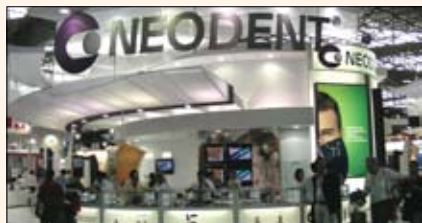
El imponente stand de la empresa de implantes brasileña Neodent ( www.neodent.com.br ) durante la reciente feria de CIOSP, donde presentó su nuevo implante corto medular y cortical Titamax WS.

experimentaron un aumento en ventas del 30% en relación a 2008. La mayoría de los fabricantes brasileños de productos odontológicos estuvieron presentes, como Neodent (implantes), VK Driller, KaVo, Conexao, Gnatus, Dabi Atlante, Schultz, Biodinámica o Implantes SIN, al igual que extranjeras, entre ellas 80 norteamericanas como Kodak, 3M, A-dec o la canadiense Consult-Pro; europeas como Nobel Biocare, Vita, VOCO, Ivoclar, Forestadent o Cavex, y un Pabellón Suizo completo. La próxima edición de CIOSP tendrá lugar del 30 de enero al 3 de febrero de 2010. Para información visite www.apcd.org.br .