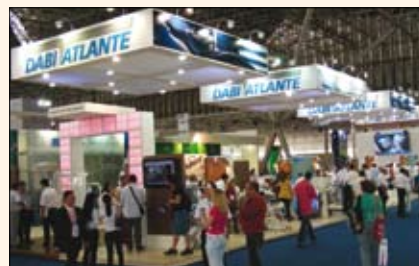
La prestigiosa marca Dabi Atlante ( www.dabi.com.br ) fabrica desde piezas de mano hasta sistemas de radiología digital y equipos completos para el consultorio.