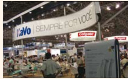
KaVo ( www.kavo.com.br ) cumple cien años en 2009, motivo por el cual está ampliando su línea de productos, que incluyen ahora dispositivos tan avanzados como el aparato de rayos X digital Gendex.