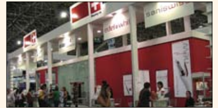
El Pabellón Suizo en la expo atrajo la atención por la calidad de las empresas presentes, como SaniSwiss ( www.saniswiss.com ), EdelWhite ( www.edel-white.com ) o Jota ( www.jota.ch ).