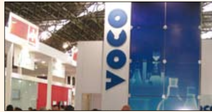
El material para restauración Amarilis de VOCO ( www.voco.com ) fue la gran novedad en esta feria de esta compañía alemana conocida por la alta calidad de sus productos.