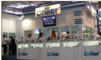
VK Driller ( www.driller.com.br ) presentó sus motores para endodoncia Endo X y para implantes quirúrgicos Master Sonic, que complementan su amplia línea de fresas eléctricas.