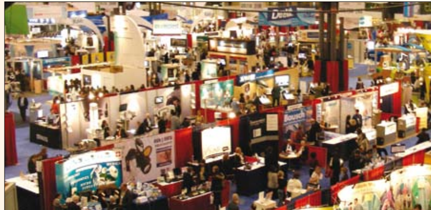
Vista del Greater New York Dental Meeting (www.gnydm.com), la mayor feria de la industria odontológica de Estados Unidos.