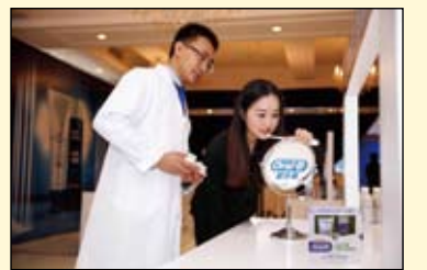
与会者现场体验欧乐B洁齿护龈家用双管套装

管套装，突破性地将深层清洁与后续修护的活性成分独立封存于两管中。使专业护龈成分可以释放更有效的活性因子，到达难刷部位，深层洁净；并能形成保护膜，实现1+1大于2的效果。