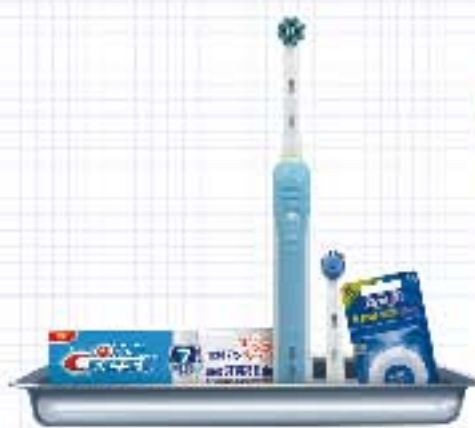
专业洁牙护理计划