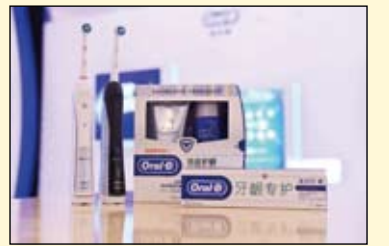
欧乐B洁齿护龈家用双管套装及牙龈专护系列

与欧乐B洁齿护龈家用双管套装同步上市的还有3款牙龈专护牙膏。通过全套护龈系列产品的推出，欧乐B将口腔专业护理成分与功效浓缩于家用，为万千中国消费者提供更全方位的家庭专业口腔护理体验。