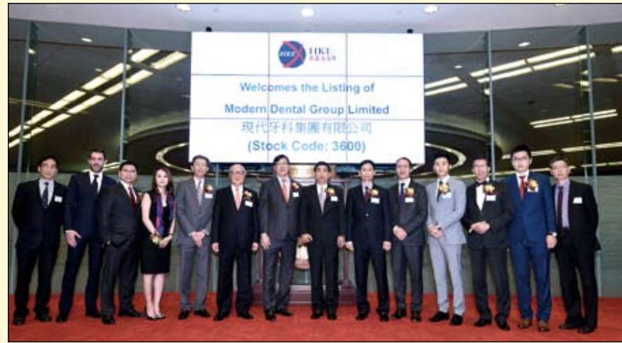
现代牙科集团在香港主板市场成功上市

为开拓中国内地市场，现代牙科集团于1998年投资成立了洋紫荆牙科器材(深圳)有限公司。2009年洋紫荆牙科器材(深圳)有限公司又投资成立了洋紫荆牙科器材(北京)有限公司，负责中国北方的市场。目前，洋紫荆已成为中国内地市场最大的义齿制作公司之一，在业界享有良好口碑，客户群遍及内地各大中城市，国内数十所知名大学