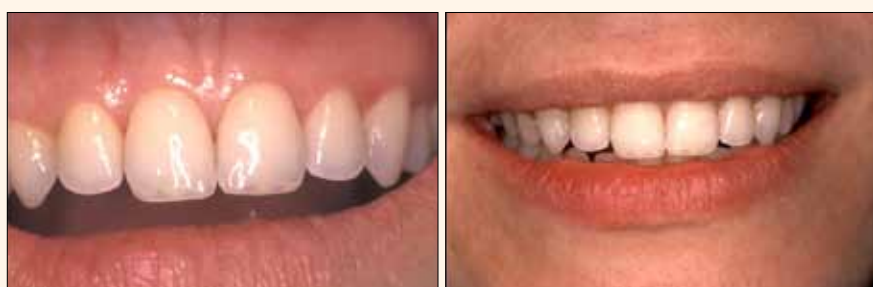
Figs. 6 y 7. Belleza de la terminación. No se percibe la línea de unión por la difusión lograda con Enamel Neutral de Amelogen Plus (Ultradent). Se aprecia el halo blanco incisal, efectos de opalescencia, mamelones y paso de luz entre ellos.