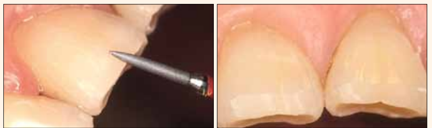
Figs. 3 y 4. Biselado para lograr un mejor patrón de grabado.