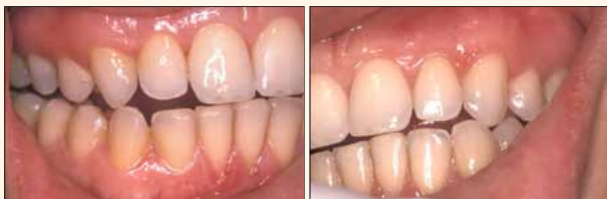
Figs. 4 y 5. Agregado en caninos. Restitución de lateralidades.