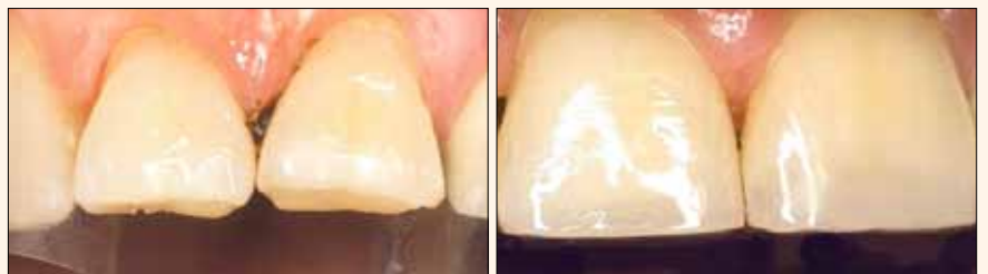
Fig. 7. Ubicación de la resina de dentina en su lugar histológico (Principio de Biomimética-Magne, Belser)