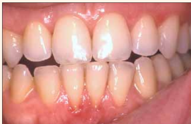
Fig. 3. Restauración de bordes de incisivos centrales superiores, y equilibrado de bordes incisales inferiores. Función de propulsión.