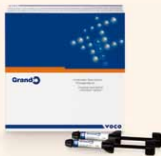
El material de restauración Grandio.