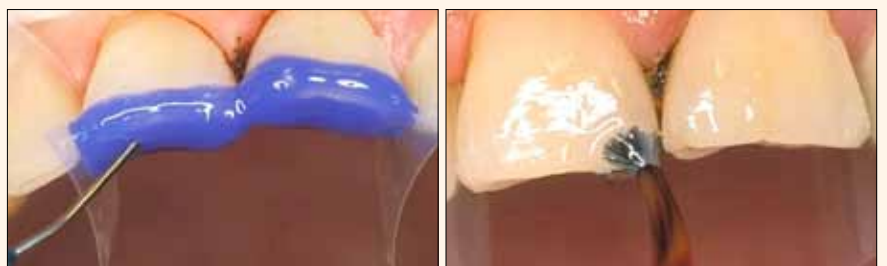
Fig. 5. Grabado con ácido autolimitante UltraEtch (Ultradent).