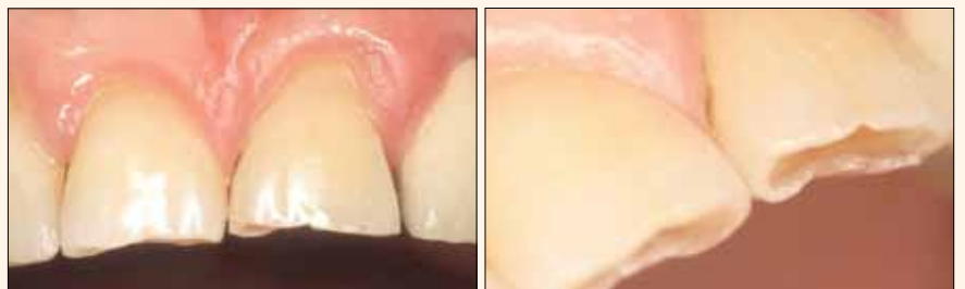
Figs. 1 y 2. Caso Inicial. Profundo desgaste de los bordes incisales.

La restauración de piezas dentarias adultas utilizando Trans White de Amelogen Plus obtuvo también un resultado estético, pero diferente del caso anterior.