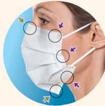
El diseño de las máscaras de Crosstex reduce los huecos en la parte superior, inferior y en los laterales mediante tiras de aluminio que se ajustan a la nariz y la barbilla.

Y para apoyar la lucha contra el cáncer en la mujer, Crosstex lanzó el programa "Pink with a Purpose", donando una parte de los beneficios al Centro Sloan-Kettering de lucha contra el cáncer. Porque para Crosstex, el punto de partida de la protección es la fabricación y el desarrollo