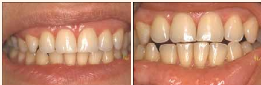
Figs. 1 y 2. Bordes superiores desgastados, disfunciones y piezas inferiores extruídas.

La restauración de piezas dentarias jóvenes utilizando Enamel Neutral de Amelogen Plus obtuvo muy buenos resultados, como se muestra en las imágenes.