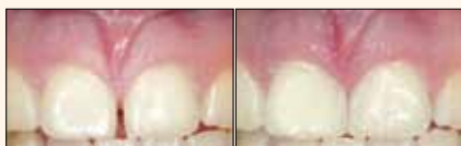
Figuras 1 y 2. El fin de espacios intermedios con Grandio: restauraciones estables, estética natural (Dr. Marcelo Balsamo, São Paulo/Brasil).