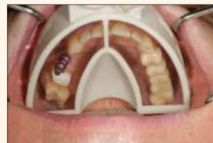
Fig. 3. Manejo fácil y limpio. No se mancha cuando se toma la impresión.

¿Ha tenido problemas de falta de espacio debido a la posición vestibular (o