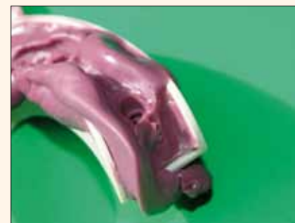
Fig. 5. Otra característica específica: ¿qué hacer en caso de que la bandeja sea «demasiado larga» por vestibular y resulta imposible tomar una impresión correcta?