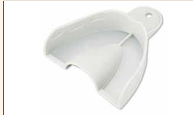
Fig. 2. La innovadora «técnica de papel de aluminio» es revolucionaria: evita tener que fabricar una (cara) cubeta individual —sea como fuere que personalice su bandeja (facturación)— y además le evita a usted y su paciente una segunda cita.