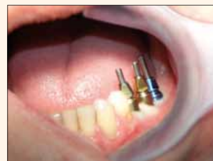
Fig. 4. Una situación familiar: tres implantes con postes atornillados para impresión abierta (pick-up).