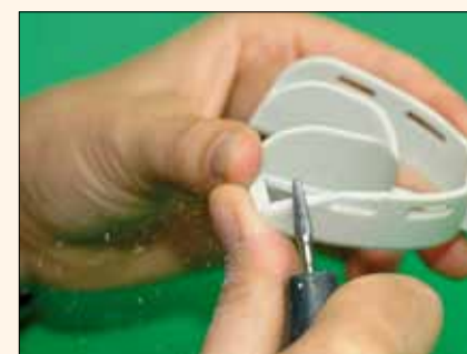
Fig. 6. Use una fresa para adaptarse fácilmente las necesidades del caso.

* Odontólogo y periodista médico alemán. Contacto: info@der-zahmann.de