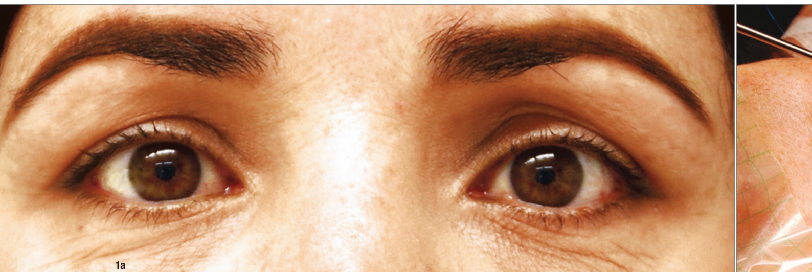
Abb. 1a: Ethnische Dysbalance der Oberlidfettkörper bei leichter, lateralbetonter Blepharochalasis und asymmetrischem Volumendefizit im nasalen Fettkompartiment.

Am Unterlid kann bei subziliarem Zugang das Belassen eines präarsalen MOO-Streifens im Sinne der „step incision“ nach Converse für die Ektropiumprophylaxe nicht oft genug betont werden. Haut- und Muskelinzision sind damit auf verschiedenen Niveaus und unterschiedlich weit vom Tarsus entfernt! Der MOO am Unterlid ist oft wesentlich dünner und gedehnter als am Oberlid und gleichzeitig von herausragender Bedeutung für die spätere Resuspension. Exakte Präparation in den Schichten und sehr sparsame Elektrokoagulation sind daher wichtig.