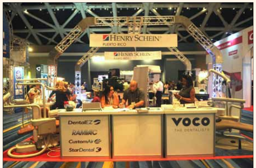
El stand de Henry Schein fue uno de los mayores de la exposición comercial.