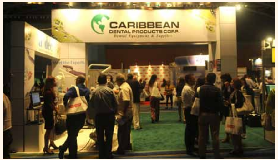
El stand del distribuidor Caribbean Dental en el congreso del Colegio de Cirujanos Dentistas de Puerto Rico.