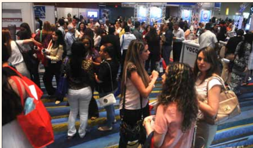
Vista general de la asistencia al congreso.