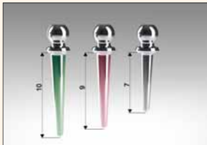
Las tres longitudes de los pivotes radiculares Titanium Pivot Block: 7, 9 y 10 mm.

Rhein'83 se complace en presentar su nueva línea Titanium Pivot Block. Con el fin de asegurar una mejor identificación de los pivotes, cada color específico corresponde a una longitud determinada. Los pivotes vienen en 2 diámetros: microesfera, con un diámetro de 1,8 mm, y normoesfera, con un diámetro de 2,5 mm. Cada línea tiene 3 longitudes diferentes: 7, 9 y 10 mm. El innovador diseño de la línea Titanium Pivot Block ofrece la solución perfecta para la fijación temporal. Para utilizar los pivotes como una solución permanente hay que crear el canal radicular necesario con una fresa especial. Como parte de la línea de pivotes de titanio, está también disponible la innovadora conexión flexible, Pivot Flex, que gracias a un cabezal giratorio permite la inserción sin trauma de la prótesis. Cada Pivot Flex tiene una capacidad de rotación de 7,5 grados en todas las direcciones con objeto de resolver problemas de divergencia. Los pivotes Rhein son la solución perfecta para una terapia preimplantar, que permite conservar la estabilidad y la función de la raíz. En casos clínicos comprometidos que requieren de «primeros auxilios», los pivotes Rhein son la aplicación perfecta, la cual le ofrece una solución funcional y de calidad, reduciendo costos y tiempos de trabajo.