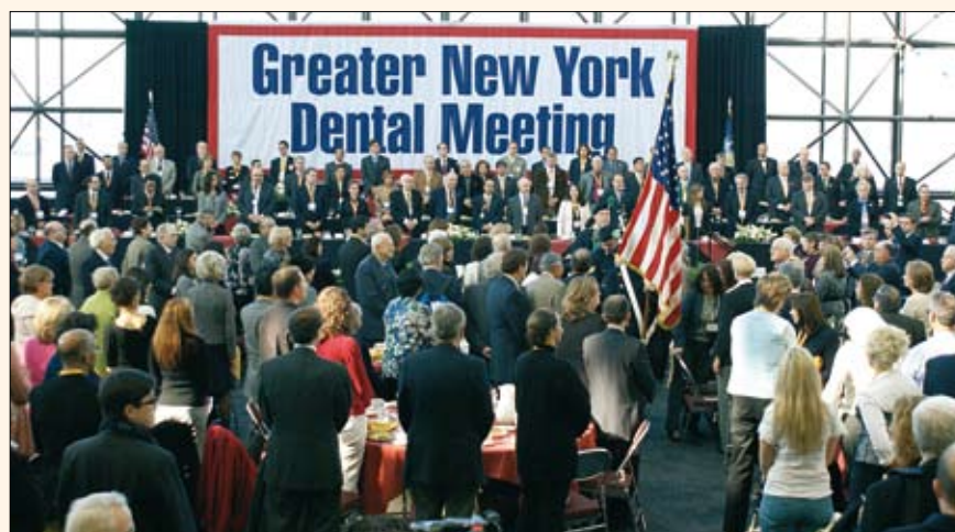
El Greater New York Dental Meeting ( www.gnydm.com ) siempre ha ofrecido el más alto nivel en cursos educativos y productos comerciales, pero sus programas sociales son también de primera clase. La asistencia de 57,854 personas de 123 países confirmó que el evento es la mayor convención dental en Estados Unidos. El Almuerzo para Presidentes se celebró el 1 de diciembre y al mismo asistieron 56 presidentes de asociaciones dentales de todo el mundo, que fueron reconocidos por sus contribuciones. Marque su calendario para la convención de 2009, que tendrá lugar del 27 de noviembre al 2 de diciembre, y recuerde que la inscripción es gratuita.