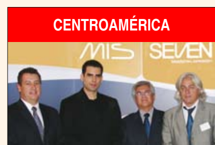
CENTROAMÉRICA I Simposio Centroamericano de Implantes MIS Página 20