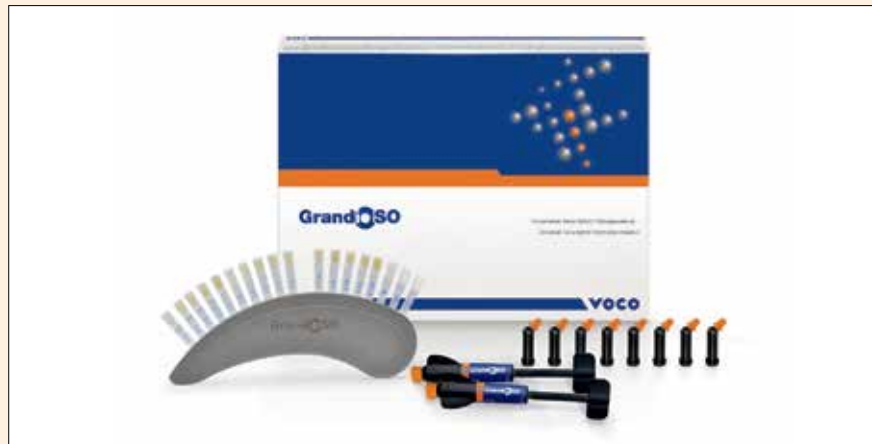
GrandioSO, el material de obturación nanohíbrido para restauraciones anteriores y posteriores.