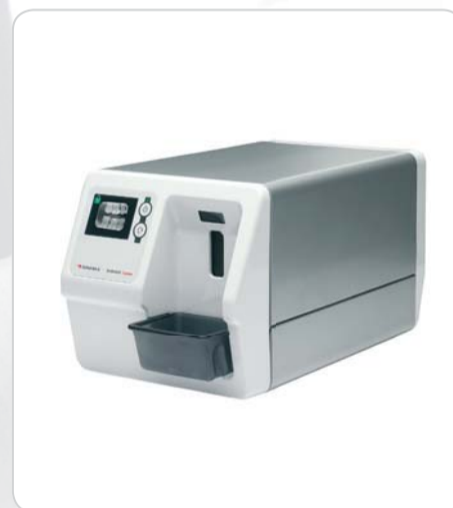
DIGORA® Optime UV