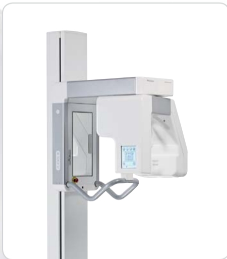
CRANEX® Novus e