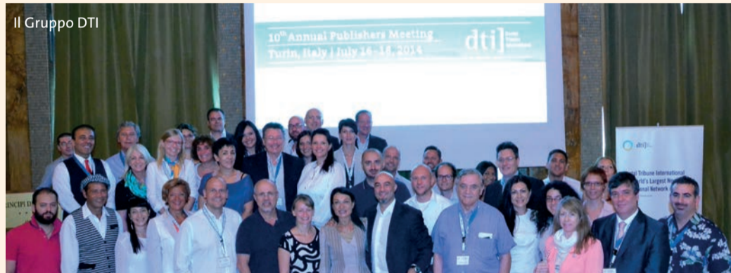
Il Gruppo DTI