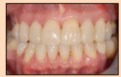
Slika 15, slučaj 5: Privremene fasete od materijala Structure Premium. Visok sjaj postignut poliranjem u probnoj fazi održan je i nakon 14 dana tokom probe konačnih faseta.

U slučajevima gde se planiraju značajnije izmene okluzije ili spoljnog izgleda, upotreba dijagnostičkog voska za uzimanje otiska je bolja alternativa za izradu osnove nadoknade. Ponavljam da je sposobnost precizne reprodukcije trenutnog