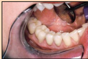
Slika 1, slučaj 1: Privremena krunica od materijala Struktur 2 SC na zubu 46, prikaz precizne reprodukcije originalne krunice (koja mora biti zamenjena zbog hroničnog distalnog karijesa).

Trenutno, najpopularniji metod izrade privremenih nadoknada (u slučajevima gde se radi o relativno malim promenama na postojećoj strukturi) započinje uzimanjem otiska, bilo korišćenjem osnovne otisne mase ili osnovne otisne mase i silikona za korekcionu otisak, postojećeg zuba ili nadoknade. Ovaj jednostavan i pouzdan metod omogućuje oblikovanje osnove koja će biti dovoljno elastična da bi se mogla skinuti sa predminiranih mesta i interproksimalne površine bez kidanja i deformisanja, a pri tom i dovoljno kruta da odražava originalnu građu u najsitnijim detaljima (slika 1). Još jedna prednost ove metode je u tome što se osnova može držati u ordinaciji neograničeno dugo, bez deformisanja, sve dok konačna nadoknada ne bude gotova. U slučaju neželjenog gubitka ili oštećenja nadoknade, nova nadoknada se može brzo i lako izraditi.