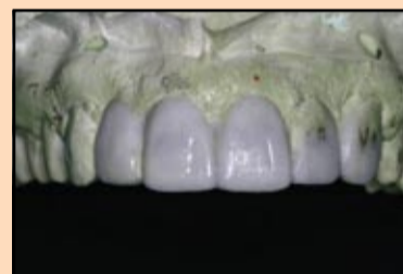
Slika 10, slučaj 3: Otisak u vosku.

njuje pojavu opisanih problema u radu (slika 5).