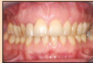
Slika 6, slučaj 2: Predoperativni prikaz sa uskim bukalnim prostorom u području od 13 do 16.