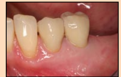
Slika 4, slučaj 1: Postavljena krunica.