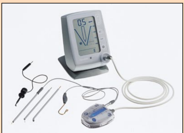
Slika 7. Elements Diagnostic Unit (SybronEndo, Orange, Calif.)

Da sumiramo, u široko otvorenom, pravom i nekomplikovanom, nekalcifikovanom kanalu, 0.12 i 0.10 konični TF instrumenti su klinički indikovani ako se pažljivo plasiraju u predelu FS. Za srednje teške kanale koriste se 0.10 i 0.08 konični TF. "Srednje teški" u ovom kontekstu znači premolari ili mezijalni koreni mnogih prosečnih molara. Korišćenje 0.10 koničnog TF instrumenta zavisi od gore pomenutih rizika. Uski, kalkifikovani, zakrivljeni i kompleksni kanali generalno zahtevaju 0.08