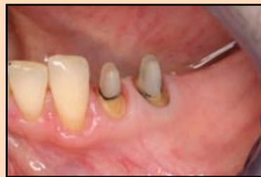
Slika 2, slučaj 1: Prikaz mekog tkiva u probnoj fazi sa optimalnim rubom gingive.