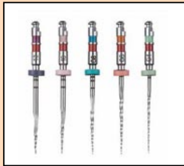
Slika 1. Spiralni instrumenti (SybronEndo, Orange, Calif.)

5. Instrumenti veće koničnosti, korišćeni apikalno, a što je moguće sa TF instrumentima, zahtevaju dobar klizni put u koji će plasirati instrumente. Upotreba kolenjaka sa recipročnim pokretima, kao što je M4 (SybronEndo, Orange, Calif), omogućava efikasnije i brže pravljenje kliznog puta u odnosu na ručnu preparaciju.