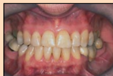
Slika 14, slučaj 5: Predoperativni prikaz.

Struktur 2 SC je samoobnavljajuća kompozitna smesa sa faznom polimerizacijom. Ovo omogućuje fleksibilnu fazu rada tokom koje se materijal još uvek može ukloniti gde je potrebno pre njegovog konačnog stvrdnjavanja, bez rizika od postizanja savršenog uklapanja. Ovo je naročito korisno tokom izrade mosta ili u radu sa većim brojem nadoknada. Vreme polime-