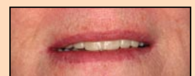
Slika 17, slučaj 5: Privremene nadoknade 14 dana nakon postavljanja.