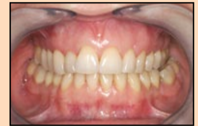
Slika 8, slučaj 2: Konačne porculanske fasete na zubima 15, 14, 13 i 12.