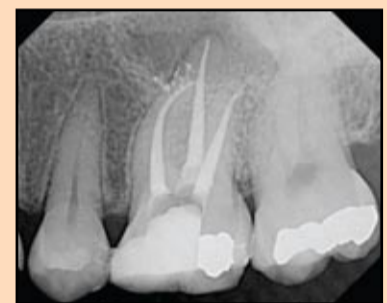
Slika 3. Klinički slučaj urađen jednim TF instrumentom.

A. 0.12 konični RNT instrumenti se koriste prvenstveno za proširivanje ulaza kanala ali ne i za srednju trećinu kanala niti za FS. Međutim, da li 0.12 RNT treba koristiti i u kruničnoj trećini