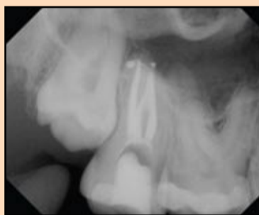
Slika 5. Tačan položaj fiziološkog suženja apeksnog foramena.

O upotrebi instrumenata različite koničnosti u različitim anatomijama kanalnog sistema diskutovaćemo u nastavku.