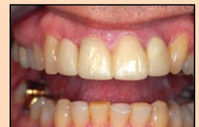
Slika 11, slučaj 3: Nadoknade koje omogućuju kvalitetno uzimanje dijagnostičkog otiska u vosku, uključujući i prenos svih detalja texture površine, što u velikoj meri olakšava planiranje promena.

rizacije je pogodno i kratko, a konačno doterivanje i poliranje moguće je već nakon tri minuta.