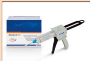
Slika 5: Promotivni set proizvoda Struktur 2 SC (samoobnavljajući materijal za privremene krunice i mostove u dozama za primenu).

Jedan od najznačajnijih aspekata uspešnog postavljanja krunice ili mosta jeste postizanje estetike mekih tkiva, a privremena nadoknada igra izuzetno značajnu ulogu u održavanju postojećeg izgleda, a u određenim slučajevima, ona pomaže izgradnji novog profila (slike 2 i 3).