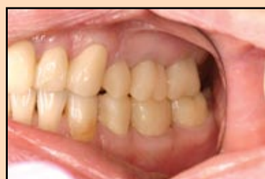
Slika 13, slučaj 4: Nadoknade od materijala Struktur 2 SC sa izvucenim novim ivicama radi postizanja idealnog gingivalnog ruba.