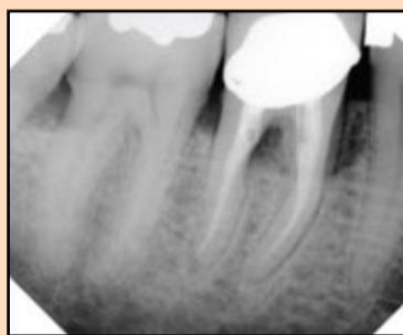
Slika 2. Prevelika koničnost dovela je do perforacije korena donjeg molara.