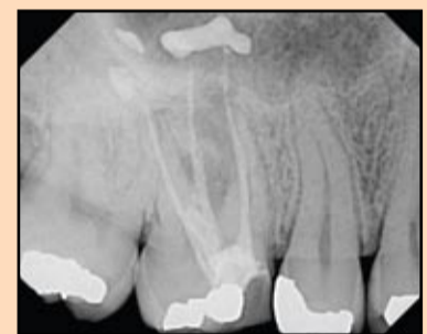
Slika 6. Nedostatak određivanja precizne radne dužine doveo je do prebacivanja silera u periapeks i jatrogne greške.

postoje situacije gde ovo može biti moguće, pa čak i poželjno. Na primer, TF instrumenti bi mogli da se koriste u apikalnoj trećini nekog široko otvorenog palatumskog korena i korena očnjaka zbog svoje fleksibilnosti i sposobnosti sečenja. Međutim, kao što je pomenuto, to bi pre bio izuzetak od pravila. Da bi ovo bilo moguće, potre-