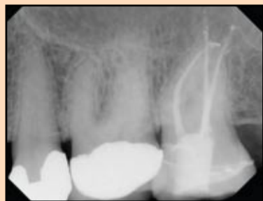
Slika 8. Klinički slučaj tretiran na način opisan u tekstu i sa „tačkom krvarenja“ kao potvrdom pozicije fiziološkog suženja apeksnog foramena.

Po definiciji, apeks lokator određuje položaj FS kada instrument prođe najuži deo kanala u predelu cemento-dentinske granice. Uprkos njihovoj pouzdanosti, postoji nekoliko problema vezanih za apeks lokatore.