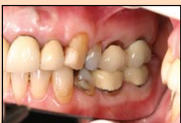
Slika 12, slučaj 4: Predoperativni prikaz.

Slike 2, 3 i 4 prikazuju kako uspeh u postizanju savršenog uklapanja nadoknade u probnoj fazi omogućuje održavanje idealnog ruba gingive tokom pripremanja subgingivalnih margina. Takav rezultat se lako postiže korišćenjem kompozita Struktur 2 SC, rad je veoma precizan a površina po stvrdnjavanju ima teksturu visoke polimerizacije i omogućuje lako