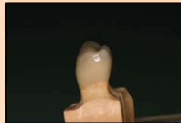
Slika 3, slučaj 1: Prikaz profila nove krunice.

Kompanija „Voco“ ponudila je rešenje ovog problema isporukom materijala koji je podeljen u dve identične doze katalizatora i baze što omogućuje idealnu kompozitnu razmeru i na taj način ujednačenu polimerizaciju, što u značajnoj meri sma-