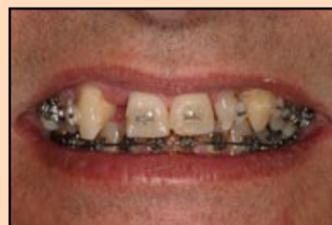
Slika 9, slučaj 3: Predoperativni prikaz.

poliranje. Ispolirana tvrda ivica nadoknade utiče na smanjenje prisustva bakterija na površini, a pacijentu olakšava održavanje higijene.