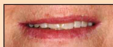
Slika 16, slučaj 5: Predoperativni prikaz.