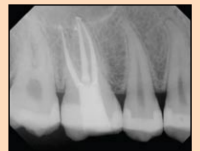
Slika 4. Klinički slučaj urađen sa dva TF instrumenta.

postoje situacije gde ovo može biti moguće, pa čak i poželjno. Na primer, TF instrumenti bi mogli da se koriste u apikalnoj trećini nekog široko otvorenog palatumskog korena i korena očnjaka zbog svoje fleksibilnosti i sposobnosti sečenja. Međutim, kao što je pomenuto, to bi pre bio izuzetak od pravila. Da bi ovo bilo moguće, potre-