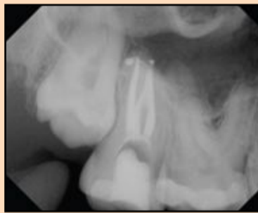
Slika 5. Tačan položaj fiziološkog suženja apeksnog foramena.

O upotrebi instrumenata različite koničnosti u različitim anatomijama kanalnog sistema diskutovaćemo u nastavku.