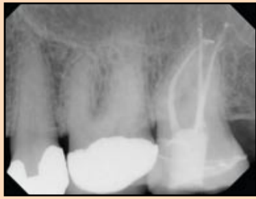
Slika 8. Klinički slučaj tretiran na način opisan u tekstu i sa „tačkom krvarenja“ kao potvrdom pozicije fiziološkog suženja apeksnog foramena.

Po definiciji, apeks lokator određuje položaj FS kada instrument prođe najuži deo kanala u predelu cemento-dentinske granice. Uprkos njihovoj pouzdanosti, postoji nekoliko problema vezanih za apeks lokatore.