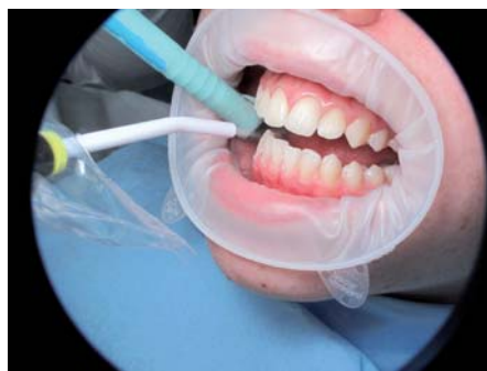
Rinçage du Fuji Ortho Gel Conditioner