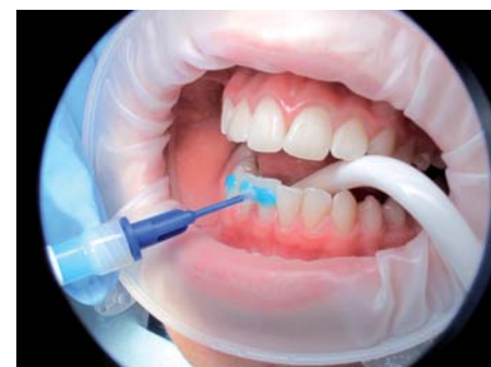
Application et brossage avec du Fuji Ortho Gel Conditioner