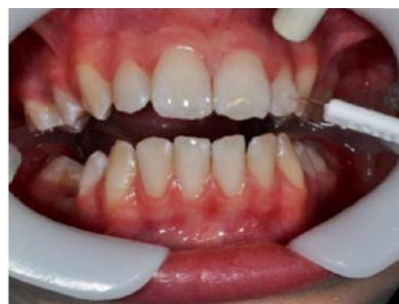
Séchage modéré en humidifiant légèrement la dent avant collage