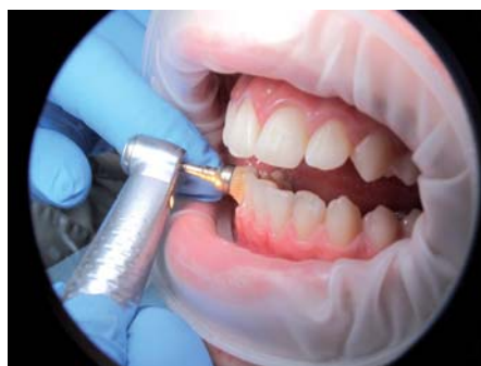
Nettoyage avec une brosse

L'adhésion des CVIMAR à l'émail a été largement décrite dans la littérature. Il semble n'y avoir en général aucune différence entre le taux d'échec des CVIMAR et celui des compo-