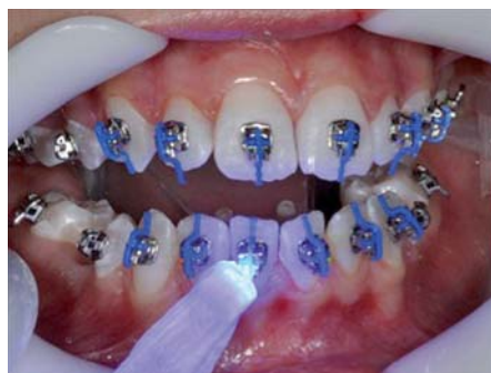
Après le positionnement du bracket, on presse lentement sur celui-ci et on élimine les excédents de colle. On photopolymérise pendant 10" chaque face