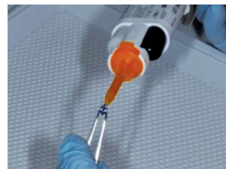
Enduction de la surface interne du bracket