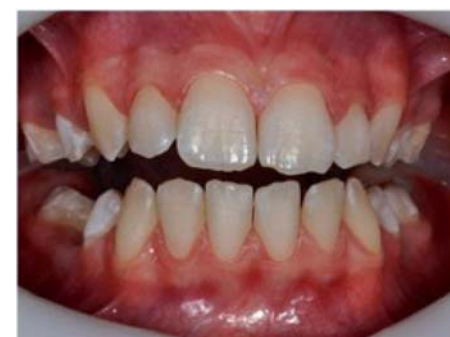
On note l'aspect brillant de l'émail traité au GC conditioner par rapport à son aspect blanc crayeux mordancé à l'acide ortho phosphorique