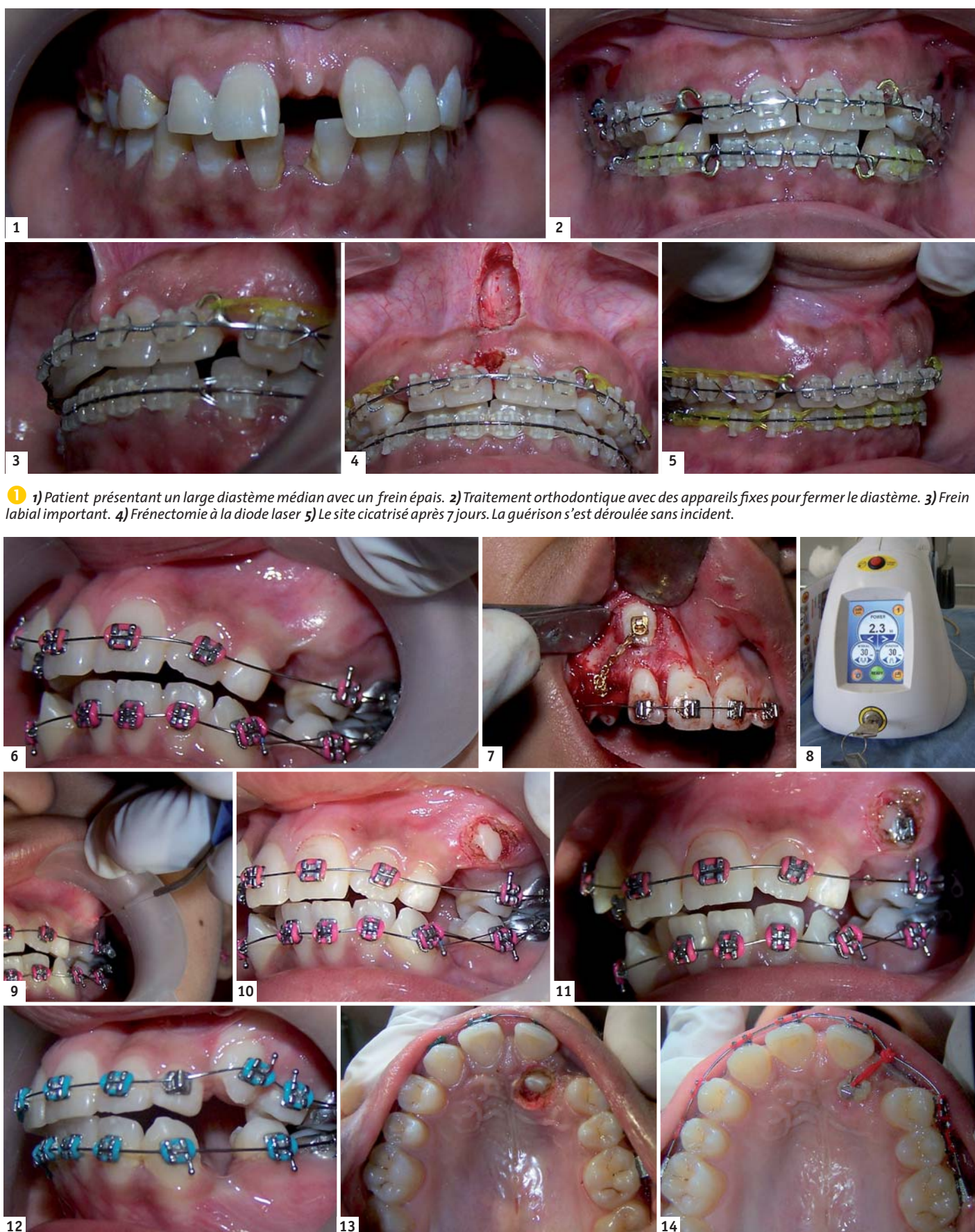
1) Patient présentant un large diastème médian avec un frein épais. 2) Traitement orthodontique avec des appareils fixes pour fermer le diastème. 3) Frein labial important. 4) Frénectomie à la diode laser 5) Le site cicatrisé après 7 jours. La guérison s'est déroulée sans incident.

Les canines en position palatine sont une situation difficile nécessitant l'élévation chi-