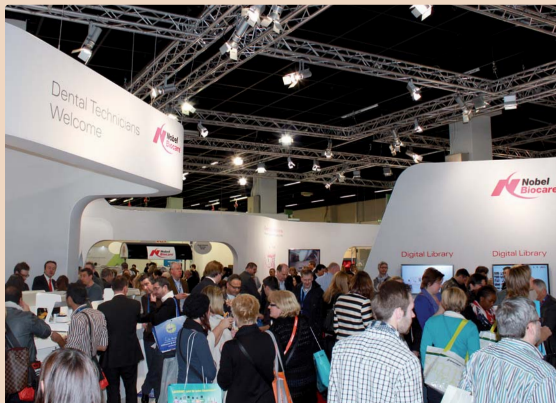
„Unsere Wachstumsstrategie baut auf drei strategischen Pfeilern: Innovative Produkte, Partnerschaft mit unseren Kunden und die Schulung.“