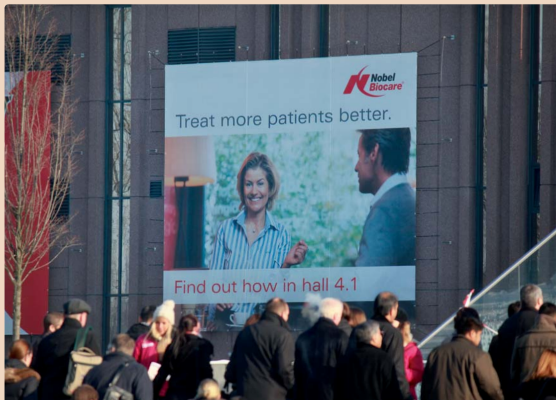
„Wir verfolgen einen gesamtheitlichen Ansatz und möchten den Behandlungsprozess für Arzt und Patient effizienter und angenehmer gestalten.“

Unter der Überschrift „Designing for Life“ hat Nobel Biocare bereits