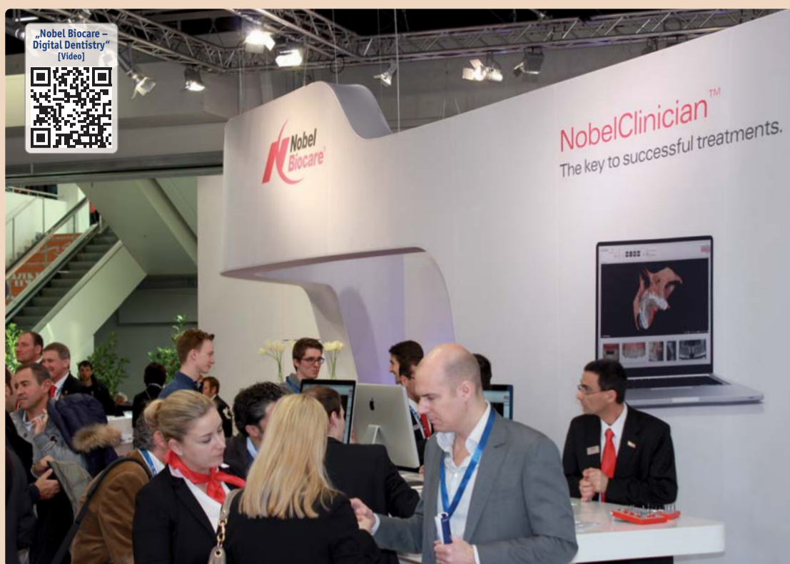
„Wir unterstützen unsere Kunden mit dem eigenen Anspruch, ein erstklassiges Produktangebot und hoch qualifiziertes Mitarbeiter-Team zu bieten.“

Es herrscht zunehmend Unsicherheit, besonders zu Fragen der Haftung und des Medizinproduktegesetzes. Sowohl der Behandler als auch der Patient sollten daher sehr sorgfältig auf langjährige Evidenz, Wissenschaftlichkeit und Erfahrung achten – eben auf den Standard eines globalen