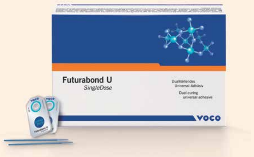
El nuevo Futurabond U de fotocurado dual de dosis única de VOCO.