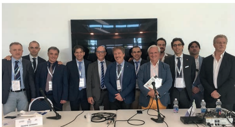
Incontro AIOLA e SILO durante il Simposio scientifico svoltosi a maggio alla Fiera di Rimini Exponential.

Iniziò allora una collaborazione "a distanza", che vide nel primo decennio lo svolgersi di alcuni importanti congressi, realizzati in