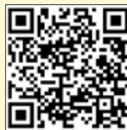
扫码观看IDS现场影像纪实