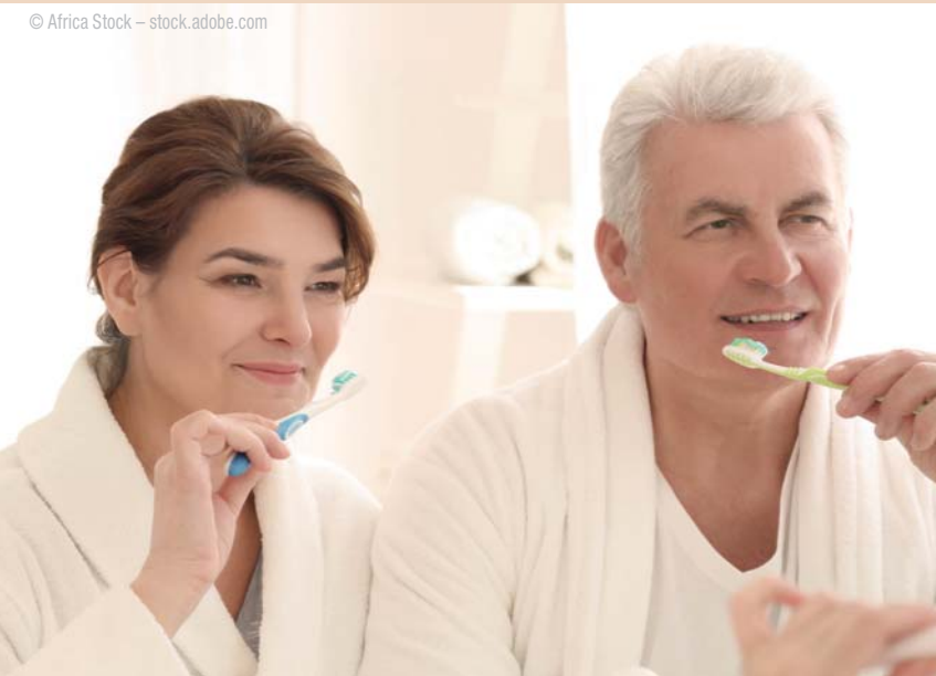
Umfrage „Mundhygiene 40plus“ – Zahnputz-Häufigkeit differenziert nach Geschlecht.

lassen sie sich auf den fachlichen Rat der Spezialisten: 43 Prozent aller Befragten folgen ihren Empfehlungen.