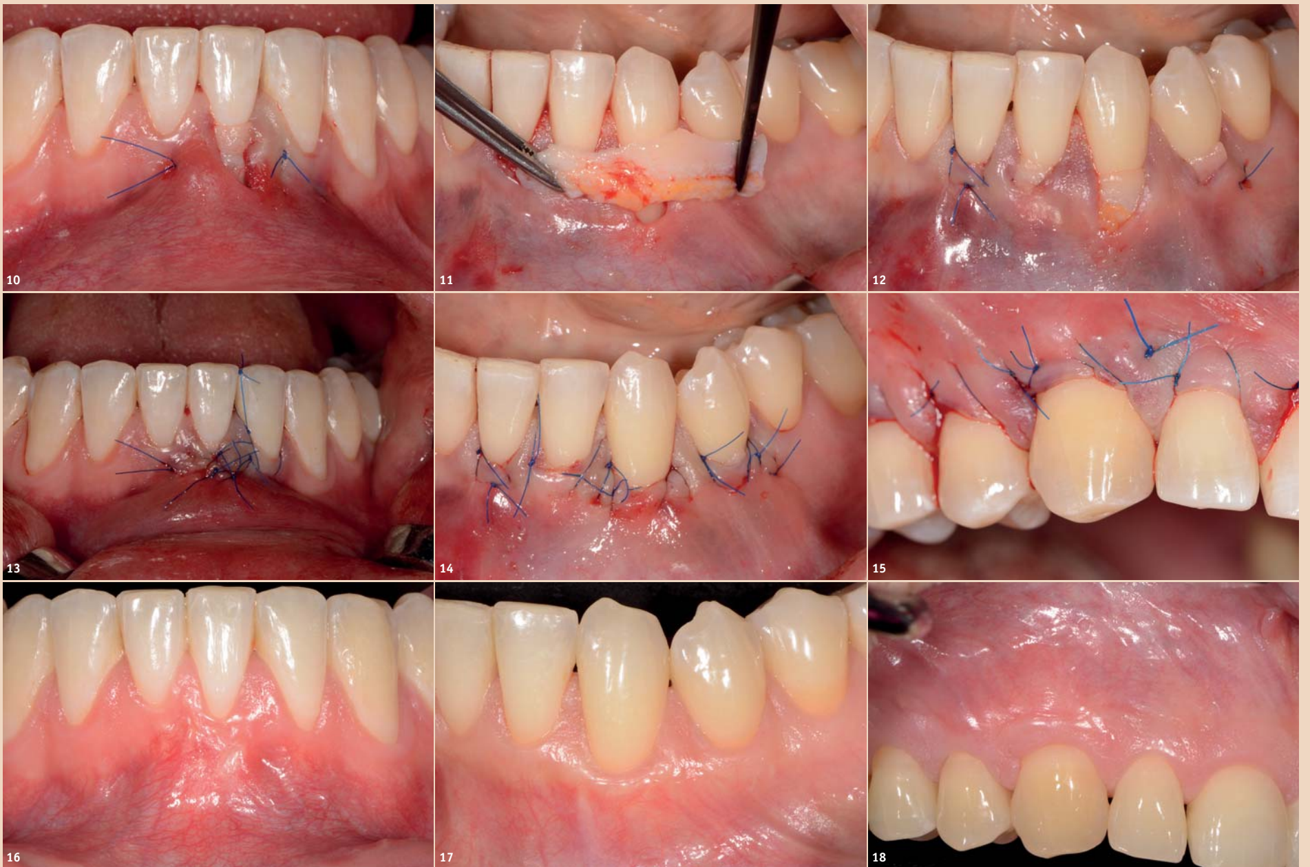
Abb. 10: Das Transplantat wurde in den Tunnel gezogen und mittels Umschlingungsnähten über die Rezession am Zahn 31 befestigt (Fall aus Abb. 1, 4, 5 und 8). – Abb. 11: Ein ausreichend langes und breites SBTG unterstützt die Papillen und verdickt das bukkale Weichgewebe (Fall aus Abb. 2, 6, 7 und 9). – Abb. 12: Das Transplantat wurde in den Tunnel gezogen und mittels Umschlingungsnähten über die Rezessionen an den Zähnen 32, 33 und 44 fixiert (Fall aus Abb. 2, 6, 7, 9 und 11). – Abb. 13: Spannungsfreie laterale Schließung der Rezession und des Transplantats am Zahn 31 (Fall aus Abb. 1, 4, 5, 8 und 10). – Abb. 14: Spannungsfreie Deckung der Rezessionen und des Transplantats an den Zähnen 32, 33 und 44 mittels Umschlingungsnähten (Fall aus Abb. 2, 6, 7, 9, 11 und 12). – Abb. 15: Spannungsfreie Deckung der Rezessionen und des Transplantats an den Zähnen 13, 14 und 15 mittels Umschlingungsnähten (Fall aus Abb. 3). – Abb. 16: Ein Jahr nach Therapie sind eine gute Wurzeldeckung sowie eine optimale Farbe und Verdickung ersichtlich (siehe Anfangsbild von Abb. 1). – Abb. 17: Klinisches Ergebnis ein Jahr nach der Therapie der in Abb. 2 abgebildeten Rezessionen. Eine hervorragende Wurzeldeckung und eine natürliche Farbe und Verdickung konnten erreicht werden. – Abb. 18: Klinisches Ergebnis fünf Jahre nach der Therapie der in Abb. 3 abgebildeten Rezessionen. Eine langzeitstabile, komplette Wurzeldeckung mit einer natürlichen Farbe wurde erreicht.

stützen (Abb. 9) (Sculean und Allen 2018; Sculean et al. 2014, 2016; Guldener et al. 2020; Lanzrein et al. 2020). Um eine optimale Stabilisierung zu erreichen, wird anschließend ein subepitheliales Bindegewebsersatzmaterial mittels Einzelknopf- oder Matratzennähten in den Tunnel gezogen und mit Umschlingungsnähten an der Schmelz-Zement-Grenze der jeweiligen Zähne fixiert (Abb. 10–12). Zum Schluss wird der Tunnelappen nach koronal oder nach lateral reponiert und mittels Umschlingungsnähten über die Zähne oder über die vorher verblockten Kontaktpunkte befestigt (Abb. 13–15).