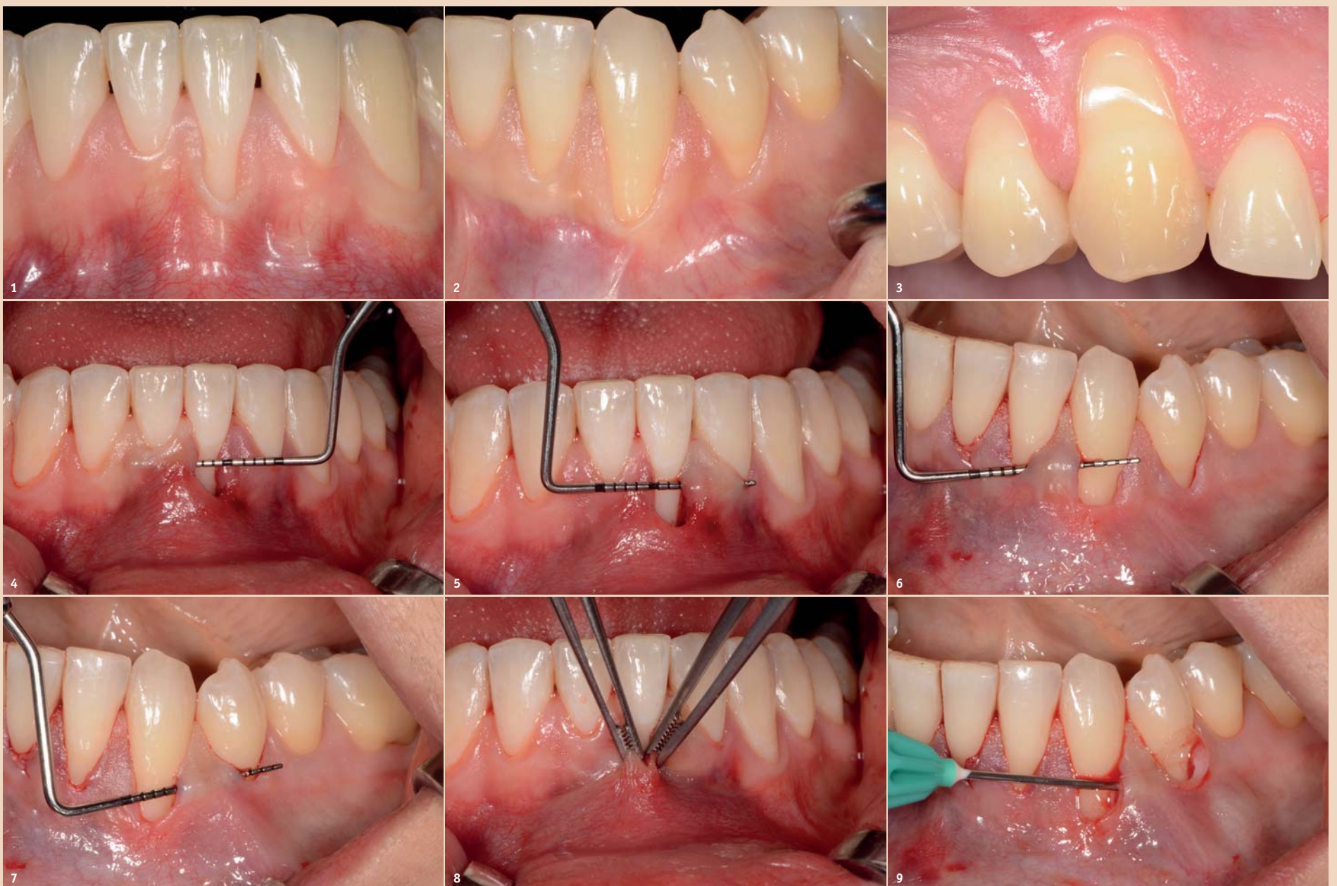
Abb. 1: Präoperative Situation einer isolierten RT 2-Rezession in der UK-Front. – Abb. 2: Präoperative Situation multipler, benachbarter RT 1-Unterkieferrezessionen. – Abb. 3: Präoperative Situation multipler, benachbarter RT 1-Oberkieferrezessionen. – Abb. 4: Tunnelierte mesiale Papille am Zahn 31 (Fall aus Abb. 1). – Abb. 5: Tunnelierte distale Papille am Zahn 31 (Fall aus Abb. 1). – Abb. 6: Tunnelierte mesiale Papille am Zahn 33 (Fall aus Abb. 2). – Abb. 7: Tunnelierte distale Papille am Zahn 33 (Fall aus Abb. 2). – Abb. 8: Der vollmobilisierte Tunnellappen kann spannungsfrei nach mesial bzw. distal über die Rezession am Zahn 31 verschoben werden (Fall aus Abb. 1, 4 und 5). – Abb. 9: Applikation von Hyaluronsäure zur Verbesserung der Wundheilung (Fall aus Abb. 2, 6 und 7).

Bei tiefen Rezessionen können biologische Materialien wie Schmelz-Matrix-Proteine oder Hyaluronsäure auf die Wurzeloberflächen appliziert werden, um die parodontale Wundheilung und Regeneration zu unter-