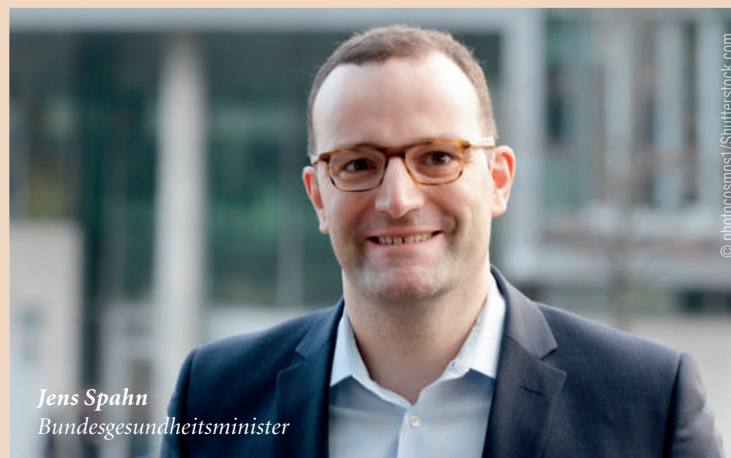
Jens Spahn Bundesgesundheitsminister

langen zu Recht, dass wir ihnen mit digitalen Lösungen den Alltag erleichtern. In einem lebenswichtigen Bereich wie der Gesundheitsversorgung muss der Staat funktionieren.