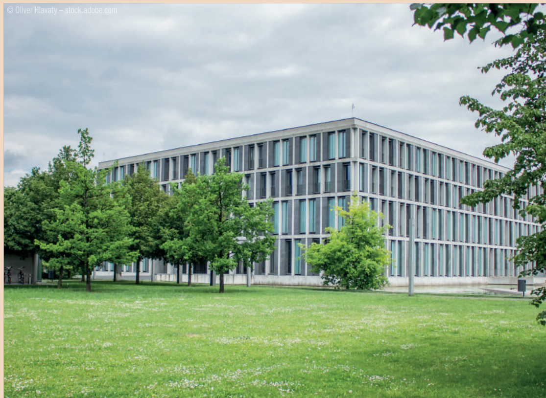
Bundesarbeitsgericht in Erfurt.

Die Revision des Beklagten hatte vor dem 9. Senat des Bundesarbeitsgerichts Erfolg. Sie führt zur Zurückverweisung der Sache an das Landesarbeitsgericht.