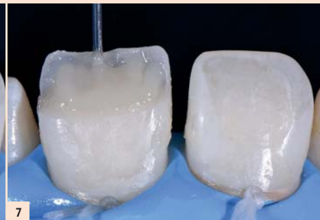
Fig. 7 : 5) Créer des digitations dentinaires : notez la prééminence des lobules dentaires et de la zone translucide les cernant. Ce contraste, après apposition de l'émail vestibulaire, fera ressortir un effet de bleu opalescent lié aux qualités de fluorescence du composite.