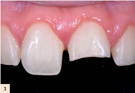
Fig. 1 : Un patient se présente en urgence à la consultation avec une fracture du tiers incisal de la 21. L'examen clinique montre une légère mobilité liée au choc, mais une absence d'atteinte pulpaire, facilitant le délai de prise en charge.