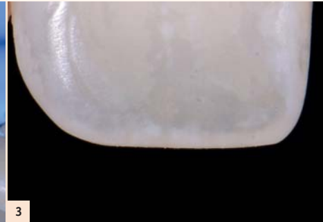
Fig. 3 : 1) Observer et conserver les références de la cartographie chromatique et la texture de surface de la dent homologue est essentiel en amont, la photographie avant intervention permettant de garder en mémoire la couleur après déshydratation.