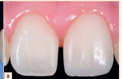
Fig. 8 : Résultat postopératoire à 12 mois. Malgré un contexte de respiration buccale favorisant un assèchement de la bouche chez ce patient de 19 ans, la restauration par composite stratifié arrive à « faire bonne figure » !