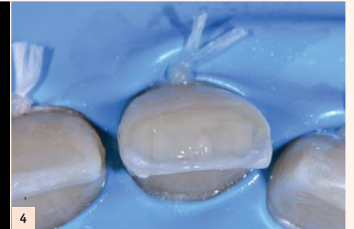
Fig. 4 : 2) Restituer la 3 e dimension, c'est-à-dire le volume palato-vestibulaire de la dent. L'utilisation d'un composite dentinaire sous forme fluide permet un modelage rapide.