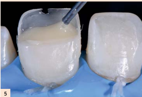
Fig. 5 : 3) Reproduire le volume interne de la dent par mimétisme : la 1 re couche de dentine donne le volume de base du noyau, la couche moyenne autorise la préfiguration, la dernière apposition finalise le volume lobulaire et précise la macrogéographie.