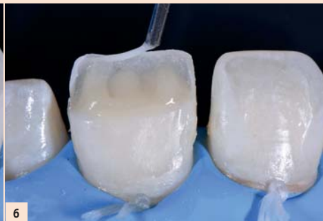
Fig. 6 : 4) Accentuer la caractérisation du bord-libre avec un blanc opalescent sous forme de flow.