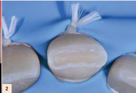
Fig. 2 : Ce large bandeau d'émail résiduel permettra un collage solide et favorable à la réalisation d'un composite stratifié. Mais cette fracture peut laisser penser que l'étendue du cosmétique et les caractérisations à reproduire peuvent rendre délicat ce type de restauration. Alors comment reproduire le naturel de ce bord-libre sans difficulté ?